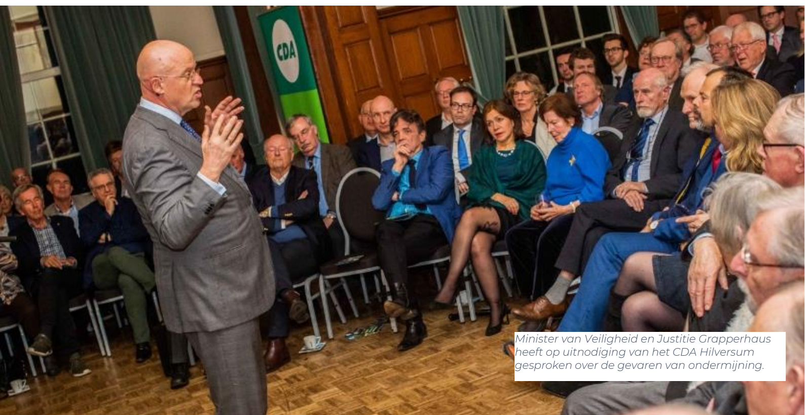
Minister van Veiligheid en Justitie Grapperhaus heeft op uitnodiging van het CDA Hilversum gesproken over de gevaren van ondermijning.

De gemeente wijst prostituees op de mogelijkheid van een uitstapprogramma. Extra voorlichting op scholen over prostitutie is gewenst.