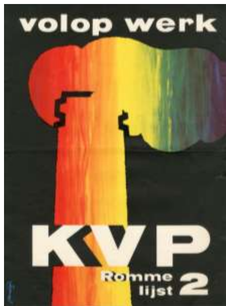
Afbeeldingen 17, 18, 19, 20