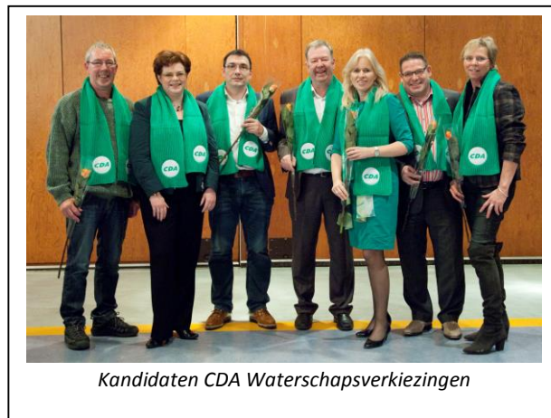
Kandidaten CDA Waterschapsverkiezingen

Stem dan op 18 maart op het CDA, lijst 3!