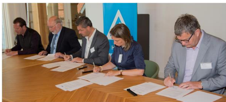
Ondertekening intentieovereenkomst regio Waterland

Eerder schreven wij in onze halfjaarberichten over de overdracht van wegen van het Hoogheemraadschap Hollands Noorderkwartier aan gemeenten. Wegbeheer is namelijk geen kerntaak van HHNK. Om zich te kunnen richten op zijn watertaken streeft HHNK ernaar het