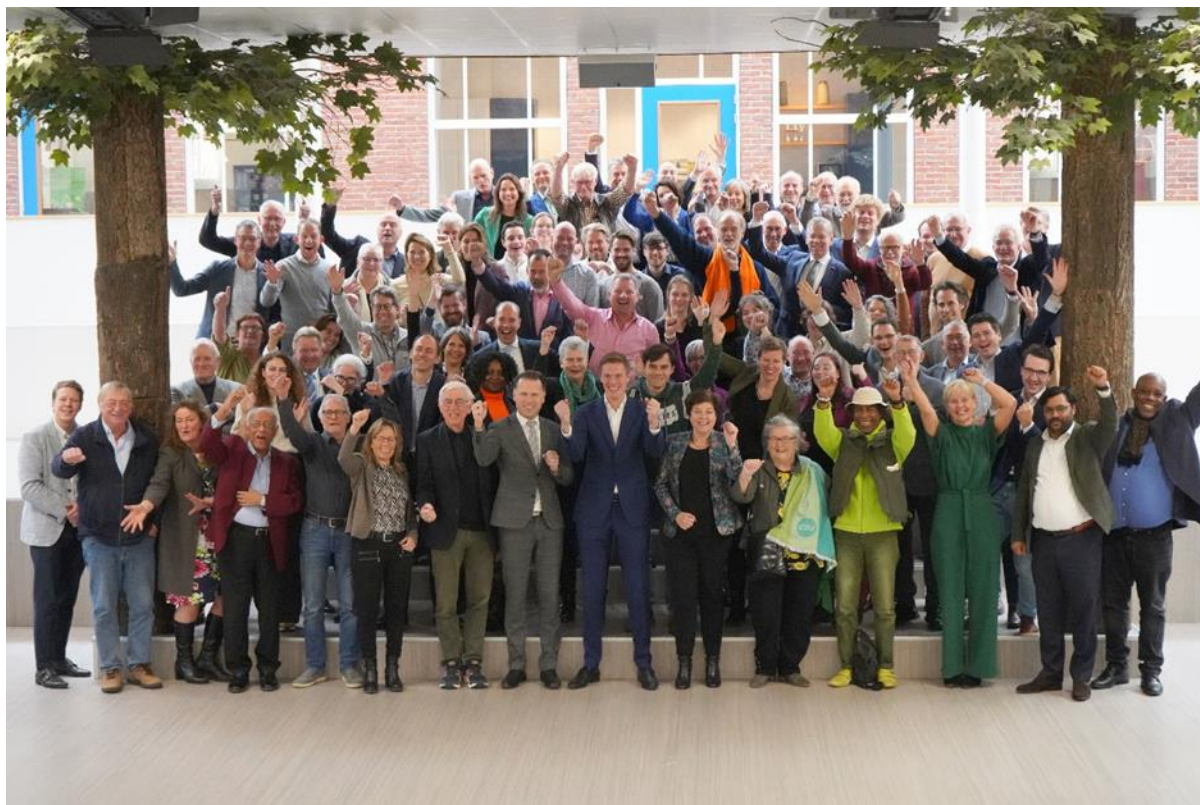
De deelnemers van de Algemene Ledenvergadering van CDA-Noord-Holland op 26 nov. jl. met daarop ook vertegenwoordigers vanuit gemeenteraadsfracties, afdelingsbesturen en de PS-fractie met wie CDA-HHNK periodiek overlegt.