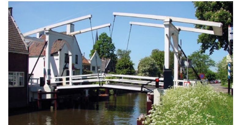
Vechtbrug bij Breukelen

Karin: "We beheren de Vecht natuurlijk wel, ook al is alles nog niet gestroomlijnd. Als er bij mijn club nu een vraag komt over de beschoeiing, dan beschikken we inmiddels wel over wat gegevens, maar voor het complete plaatje moeten we toch weer terug naar de projectgroepleden. Als straks alle gegevens op orde zijn, kunnen we gewoon zelf aan de slag. "Bij de Vecht zijn we extra kritisch. Het is zo'n grote rivier, die kun je er niet zo maar bij doen."