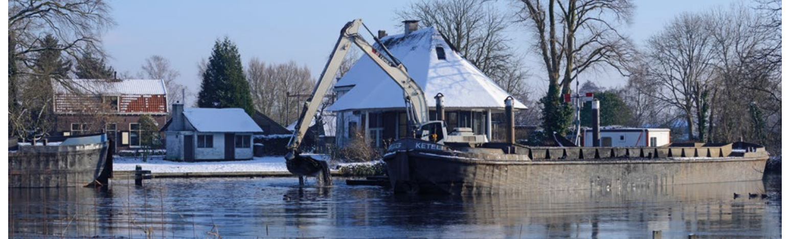
Baggerwerkzaamheden tijdens de wintermaanden

Heidi: “Het originele bestek was niet zo ingewikkeld om uit te voeren. Vooraf dachten we: het zijn allemaal rechte lijnen (de onderkant van het baggerprofiel, red.), dus dat is wel goed te doen. Na die tijd werd het model nog meerdere keren door Waternet aangepast. Het baggermodel werd daardoor steeds grilliger. En Waternet stelde aanvullende eisen. Dat zou in de toekomst anders kunnen: zorg ervoor dat bij het bestek het verontreinigingsmodel bekend is. Een en ander leidde tot intensieve gesprekken tussen ons en Waternet.”