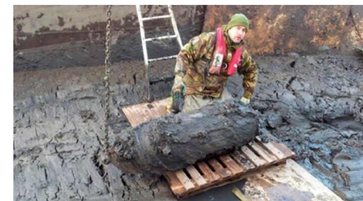
Vliegtuigenbom (1000-ponders) afgeworpen tijdens de 2e Wereldoorlog