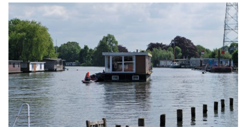
Een woonark wordt verplaatst naar een tijdelijke ligplaats