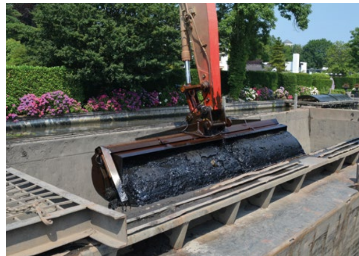
De 2 miljoenste kuub vette bagger