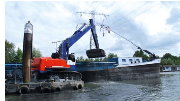
Baggerkraan Anna Catherina