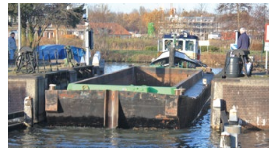
Boot door sluis van maarsse

“Ik begon in 2011 als toezichthouder op het project met aannemerscombinatie FectioPlus (Fectio is een oude Romeinse benaming voor de Vecht). Als toezichthouder ga je na of de aannemer doet wat hij omschreven heeft in zijn eigen kwaliteitsplannen. Mijn rol is veranderd in de vier jaar dat ik hem vervulde. Dat bleek al bij de aanbesteding. Het financiële verschil tussen de winnende aannemer en de nummer twee was groot. Als toezichthouder word je niet geconfronteerd met financiën, maar het was wel merkbaar dat dit op de achtergrond een rol speelde bij de aannemer. Het toezicht neigde meer naar controleren en inspecteren vanuit achterdocht. Al hadden we best een goede samenwerking, toch stond de aannemer niet altijd toe om bij alles aanwezig te zijn. In fase 1 was dat minder ingewikkeld. Daar was nog meer contact met de werkvloer.”