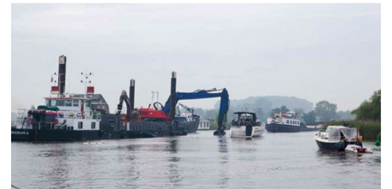
Het drukke scheepvaartverkeer gaat gewoon door tijdens de werkzaamheden

"Ik zit al vanaf 1984 op de Vecht. Eerst bij Rijkswaterstaat en nu bij het waterschap. Het is een onderdeel van mijn leven geworden, ik vind mijn werk leuk en dus ook de wateren. Ik kende de Vecht nog uit de tijd dat er volop op geloosd werd. De hele Vecht was toen wit bij Loenen. Sinds 1986 wordt er niet meer op geloosd door bedrijven en sinds 2006 niet meer door de woonarken. Door de schoonmaak is het water echt een stuk schoner geworden. Het heeft een mooie normale waterkleur. De Vecht ligt er goed bij."