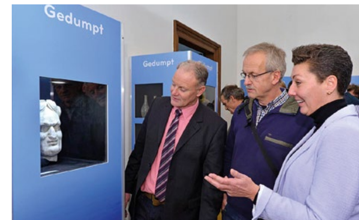
Reizende tentoonstelling Vondsten uit de Vecht

"Het is leuk dat we met zoiets positiefs als deze reizende tentoonstelling het project konden profileren. De archeologische vondsten maakten opeens het project nog meer zichtbaar. Mensen waren zó enthousiast. Het heeft het project veel goed gedaan. Maar dat niet alleen, ook het bezoekersaantal van het museum in Maarssen kreeg een enorme impuls door de expositie. Het is toch geweldig leuk dat nog tot ver na de afronding van het project de expositie op reis bleef?"