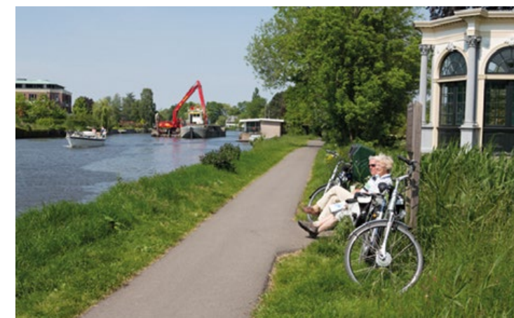
Dagjesmensen bewonderen de werkzaamheden

“Daar blijft het wat mij betreft niet bij. Een van onze speerpunten is het verblijfstoerisme. We zien graag meer toeristen die langer in onze gemeente verblijven. En dan niet met auto's. Dat verkeer kunnen we niet aan. Maar vooral wandelaars, fietsers en mensen met boten. Daar zijn we extra voorzieningen voor aan het treffen. Zo hebben we nu eindelijk een aanlegsteiger met sanitaire voorzieningen, zodat mensen ook daadwerkelijk op het water kunnen overnachten. Ik zou ook graag twee extra vuilwaterinnamepunten op de Vecht willen hebben. En ik zou graag samen met het waterschap willen kijken naar de mogelijkheden voor het invoeren van een blauwvlagbeleid. Dat is een mooie manier om aan te geven dat het water schoon is.