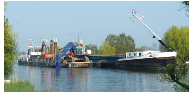
Kraanpontoon en binnenvaartschip

"In het begin hebben we last gehad van het imagoprobleem van het waterschap in het gebied. Er zat nog wel wat oud zeer bij de woonarkbewoners en dat hebben we opgepakt met Waternet. In de eerste maand hebben we alle problemen proberen te tackelen. Iedereen zette