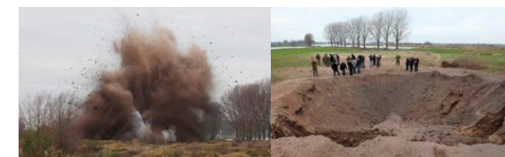
De bom wordt ter ontploffing gebacht met als resultaat een meters diepe krater