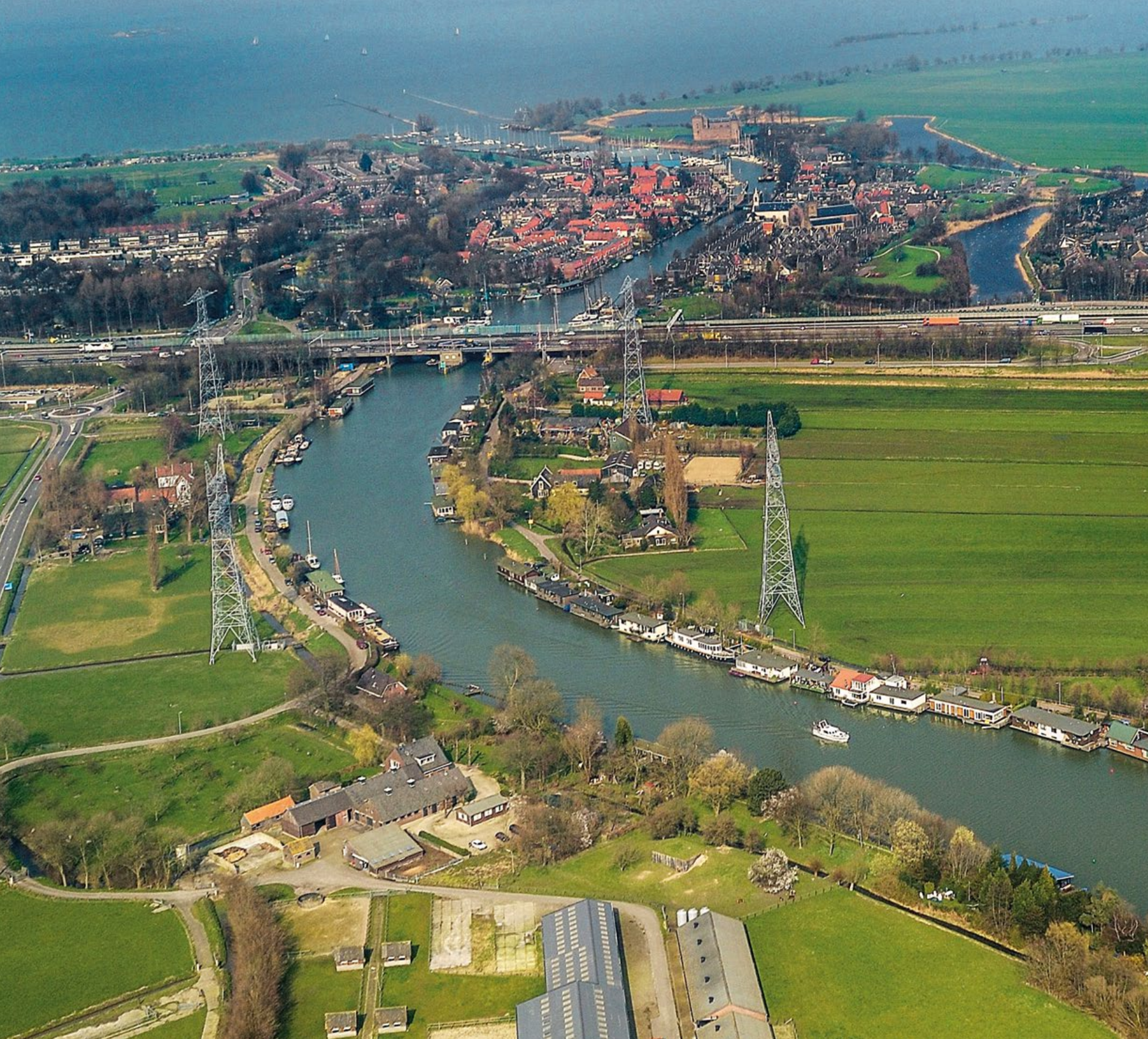
Vecht ter hoogte van Muiden