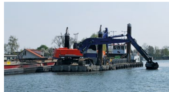
Baggerboot in werking vlak naast woonarken

“Vanaf de start van het project was ik veel buiten met een tablet, waarop het project real time te zien was. Stond er aan de kant een opa met zijn zoon te kijken naar het baggeren, dan kon ik ze van alles laten zien: wat er gebeurde, de route van het schip en waar het zich op dat moment bevond. Een mooie ijsbreker. Ook trof ik een keer een oude baas op een dijk die me vertelde over jongeren in een villa aan de overkant die in de oorlog handgranaten in de Vecht gooiden om vissen te vangen. Ze zouden iets te maken hebben met de Hitlerjugend. Ik gaf het door aan mijn collega's. Een paar weken later werd ik gebeld door jongens van de keet: 'We hebben handgranaten gevonden.' Kom ik daar aan, struikel ik over een doos waar al die granaten in zaten. Dat maakte toen wel duidelijk dat er iets aan de hand was. Dit was nog voordat de bommen en granaten in Weesp werden aangetroffen.”