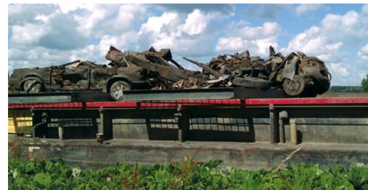
Autowrakken uit de Vecht

"Het opdroegen van een autowrak met lichamen van twee vermiste vrouwen had zo mogelijk een nog grotere impact op onze medewerkers. Onze kraanmachinisten zijn supergoed opgevangen en