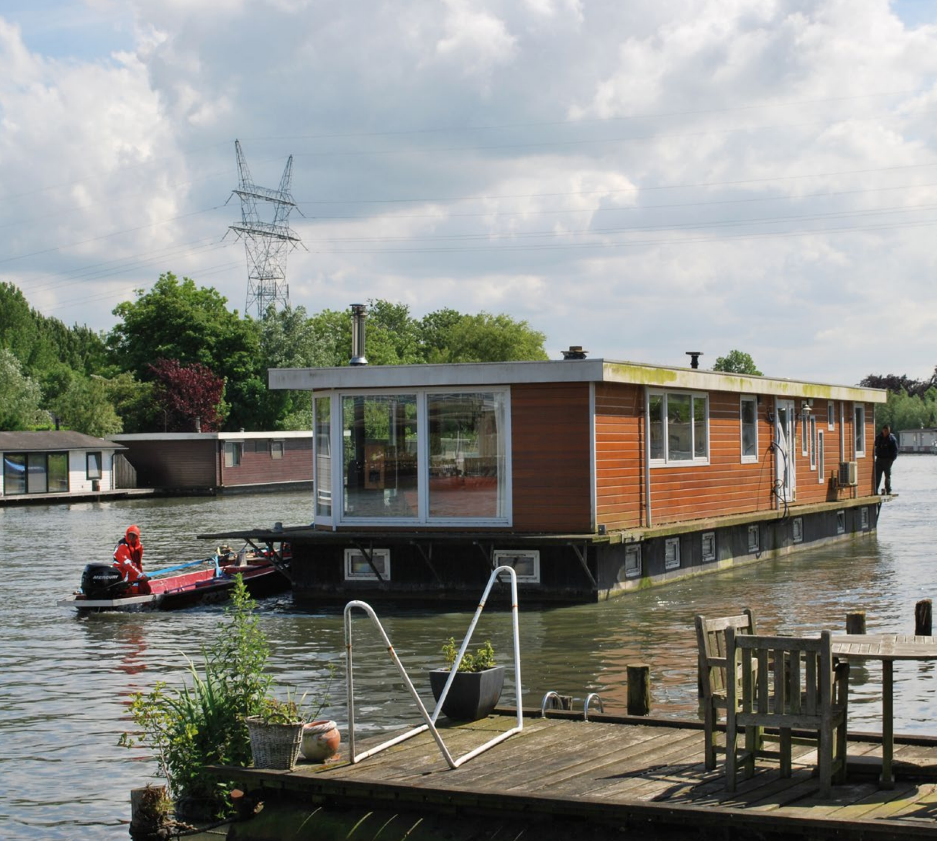
Tijdelijke verplaatsing woonark