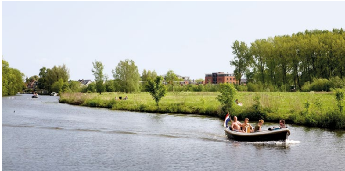
Waterrecreatie op de Vecht