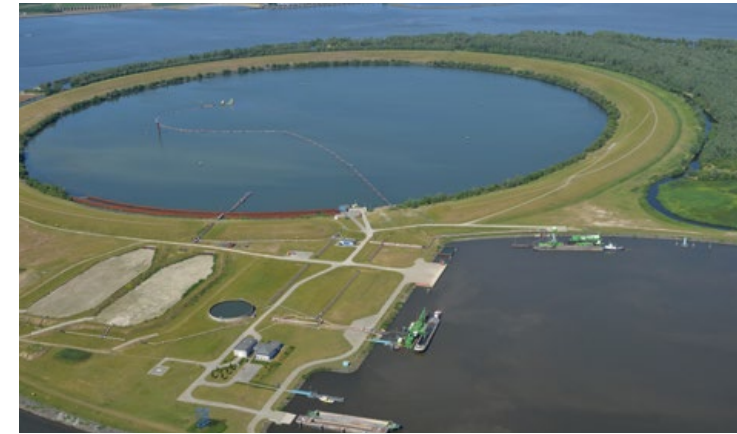
IJsseloog uit de lucht

"Op een gegeven moment werd er asbest gevonden door de toezichhouders. Dat moest de aannemer natuurlijk melden aan de inspectie. De inspecteur wilde dat we anders gingen werken en het gebied beter in kaart brachten door metingen te doen in het water. Toen hebben we een kaart gemaakt van alle plaatsen die asbestverdacht waren. De schepen die dat transporteerden, moesten anders gaan lossen in IJsseloog in verband met de mogelijke aanwezigheid van asbest. Door het aanpassen van de werkwijze konden we gelukkig door met het werk."