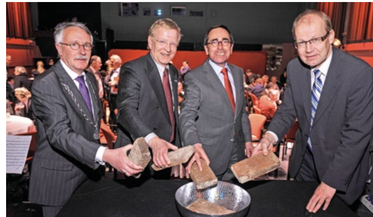
start 4 bestuurders dragen steentje bij

“Door het hele project heen heeft het dagelijks bestuur altijd het vertrouwen van het algemeen bestuur(AB) gevoeld. Ze zijn altijd heel constructief geweest. Als dagelijks bestuur kun je op die basis goed werken. Natuurlijk zijn er altijd paniekzaaiers. Maar het AB liet zich niet opjutten. Er gold juist een cultuur van samenwerken en vertrouwen. Het AB was nog niet zo politiek. Nadat dit veranderde, zag je wel meer fractievorming. Toch lukte het altijd om dwars door het AB een meerderheid te vinden voor een besluit.”