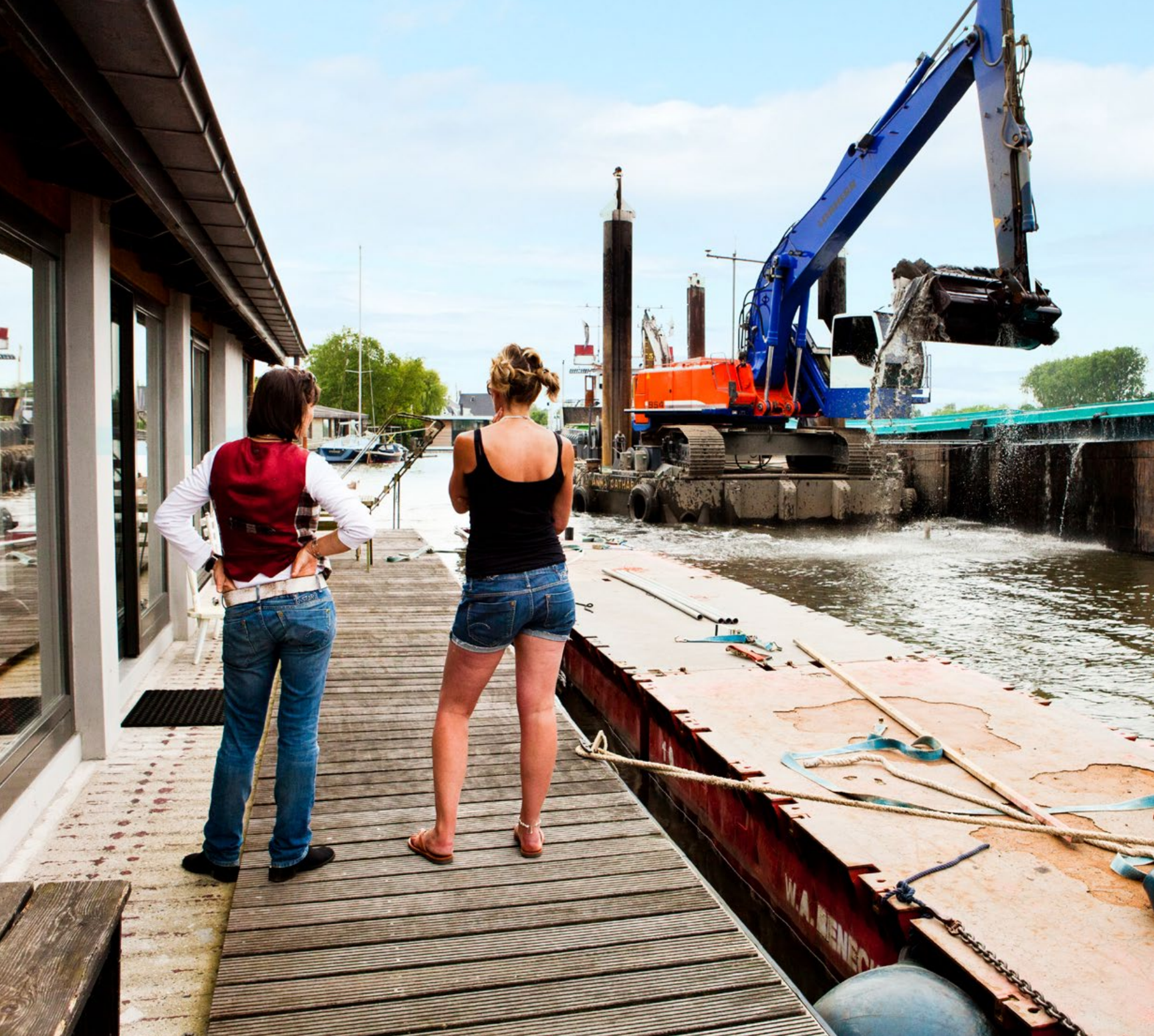
Tijdens het verslepen van hun ark bleven deze bewoners gewoon aan boord