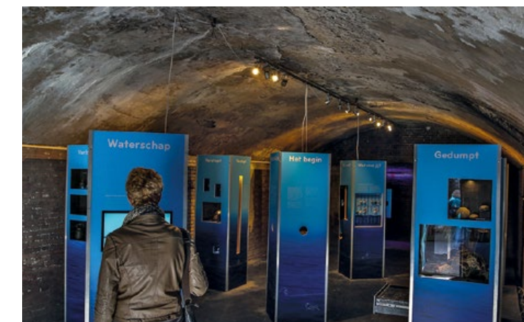
De tentoonstelling op Pampus

"Ik vond de expositie in Weesp mooi, maar de PR vond ik niet goed. Ik heb toen een voorstel opgesteld voor Waternet met allemaal ideeën voor spandoeken, affiches, films van Waternet over het baggeren, oude prenten en ander materiaal. Je moet iets ontwikkelen dat je daarna ook op andere locaties kunt gebruiken. Dat is toen goed ontvangen. De samenwerking met Waternet en het waterschap verliep heel prettig. Ze waren daar zelf ook vol energie bezig met de expositie."