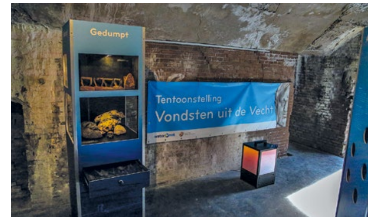
De reizende tentoonstelling in Pampus