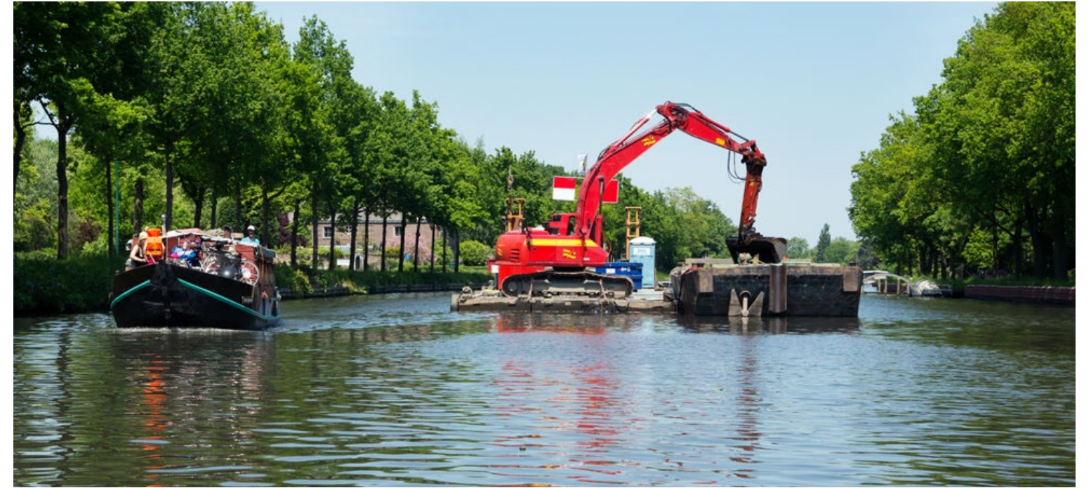
Pleziervaart tijdens de werkzaamheden

"Tijdens de werkzaamheden probeerden we zo veel mogelijk in te spelen op de verzoeken van aannemers. Op een gegeven moment wilde een aannemer een groter schip inzetten. We hebben toen met hem een proefvaart gemaakt en bekeken of dit kon. En dat ging. Op bepaalde stukken kon hij met grotere schepen varen en dus sneller werken. Voor ons had dit als voordeel dat er op een bepaald traject minder scheepvaartbeweging plaats hoefden te vinden. Ook hielden we met handhaving goed de werkzaamheden in de gaten, zodat de schepen niet te zwaar beladen waren en te diep kwamen te liggen. Er zijn weleens wat waarschuwingen afgegeven aan de aannemer."