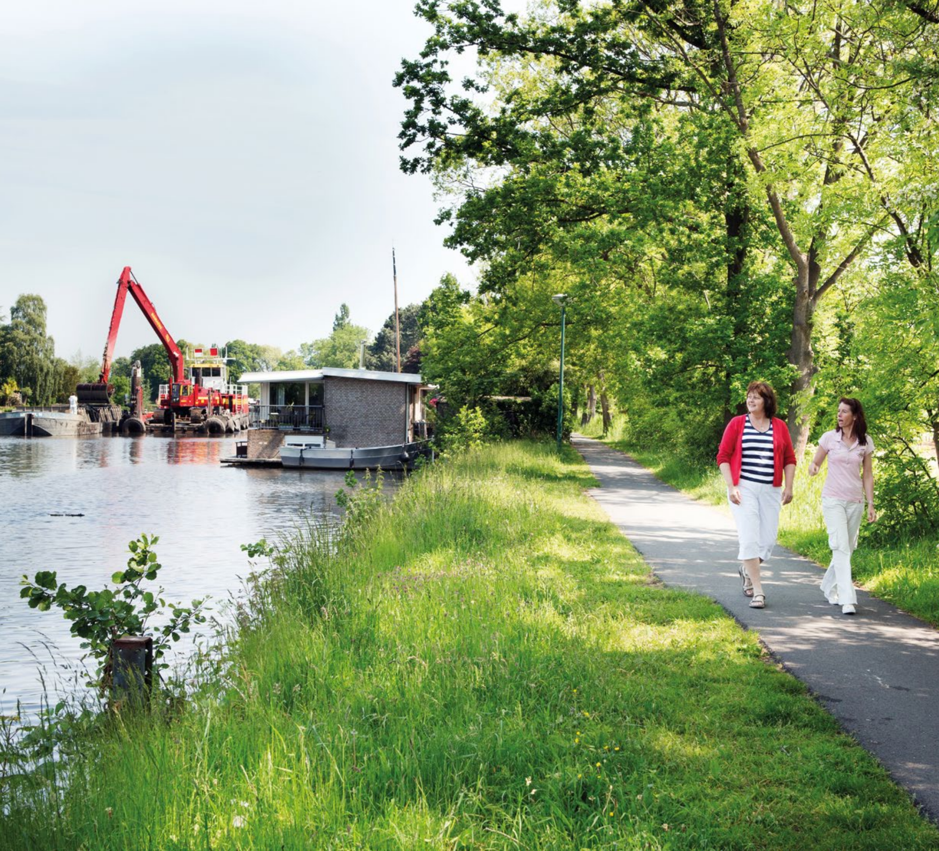
Baggeren naast een woonark