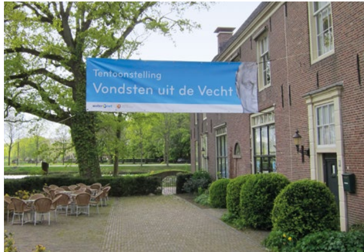
Tentoonstelling Vondsten uit de Vecht in Vechtstreekmuseum Maarssen