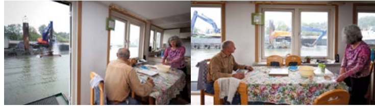
Schoonmaken Vecht gezien vanuit een woonark

“Mijn grootste frustratie was niet het baggeren, maar het persriool dat langs de woonarken loopt. De splinternieuw aangelegde rioleering is volkomen kapot getrokken tijdens de werkzaamheden. Daar had veel zorgvuldiger naar gekeken moeten worden. Dat is zo'n kapitaalvernietiging geweest. Alles is later keurig opnieuw aangelegd. Maar dat dit heeft kunnen gebeuren, is natuurlijk onbegrijpelijk. Zo onzinnig. Daar hebben alleen maar aannemers aan verdiend. Toch behoorlijk onnodige kosten.”