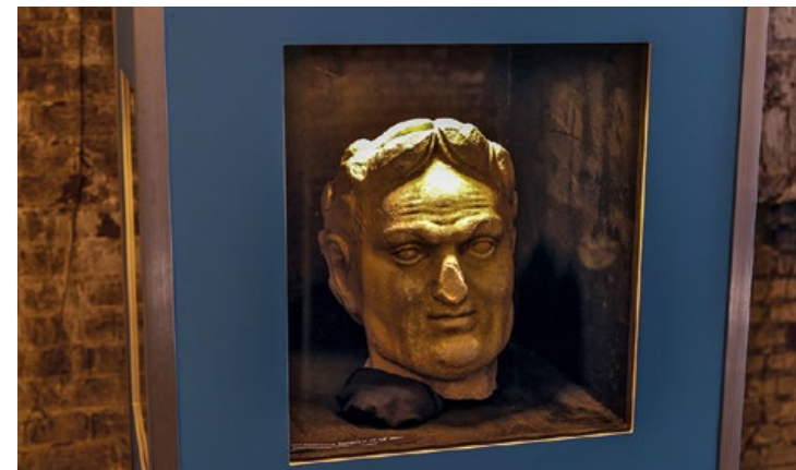
17de eeuwse beeld van de Romeinse keizer Vespasianus uit de Vecht

"Dit kwam voor mij als een complete verrassing. Ik ben gewend met een onderzoeksvraagstelling te werken en met statistieken en beperkende methoden. Archeologisch gezien was dit flinterdun. Community Archeology was voor mij een openbaring en zo iets anders dan wat ik normaal doe. Ik dacht dat het niet bij me paste. Ik kende wel wat Engelse voorbeelden en die vond ik allemaal veel te vaag. Nu ik het zelf heb meegemaakt, denk ik dat mensen anders naar archeologie zijn gaan kijken. En dat maakt ons archeologen ook duidelijk dat we meer het verhaal moeten vertellen."