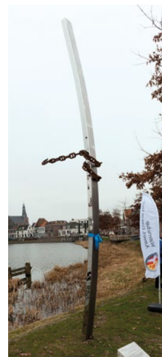
In Weesp staat het kunstwerk River Treasure van Ronald Westerhuis en Eric Blom