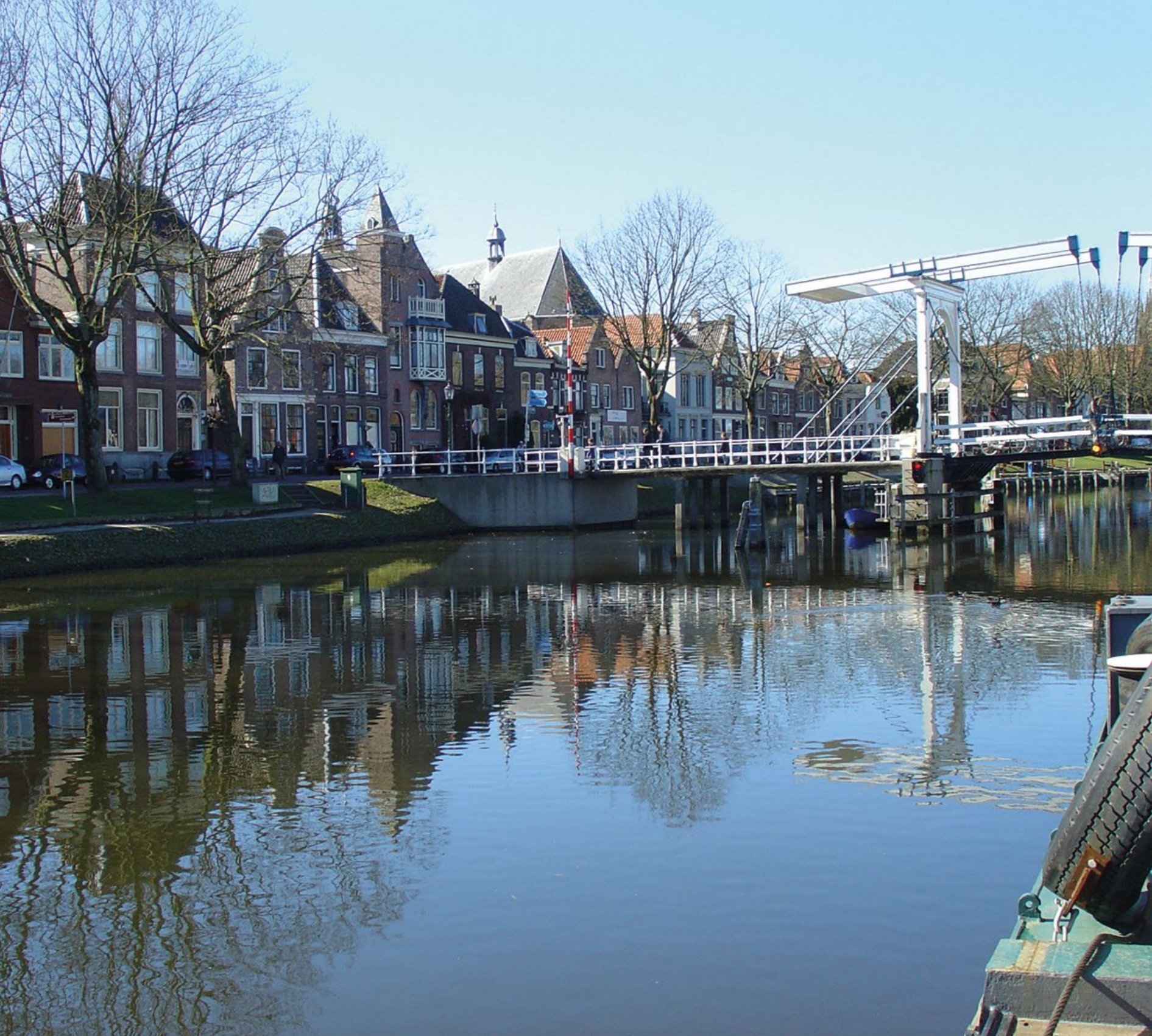
Vecht bij Weesp