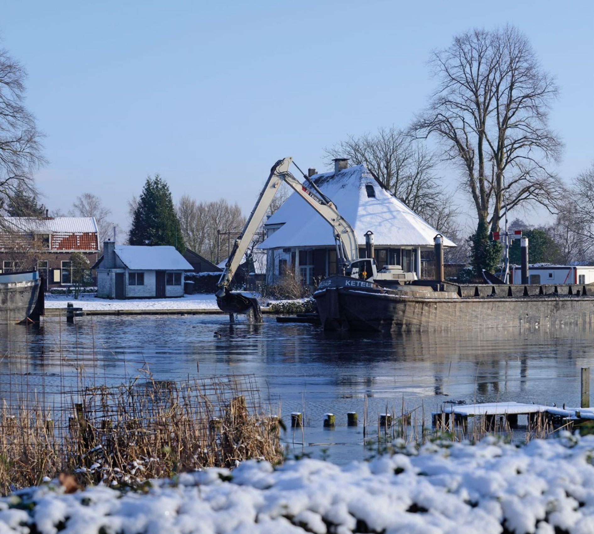
Baggeren in de winter