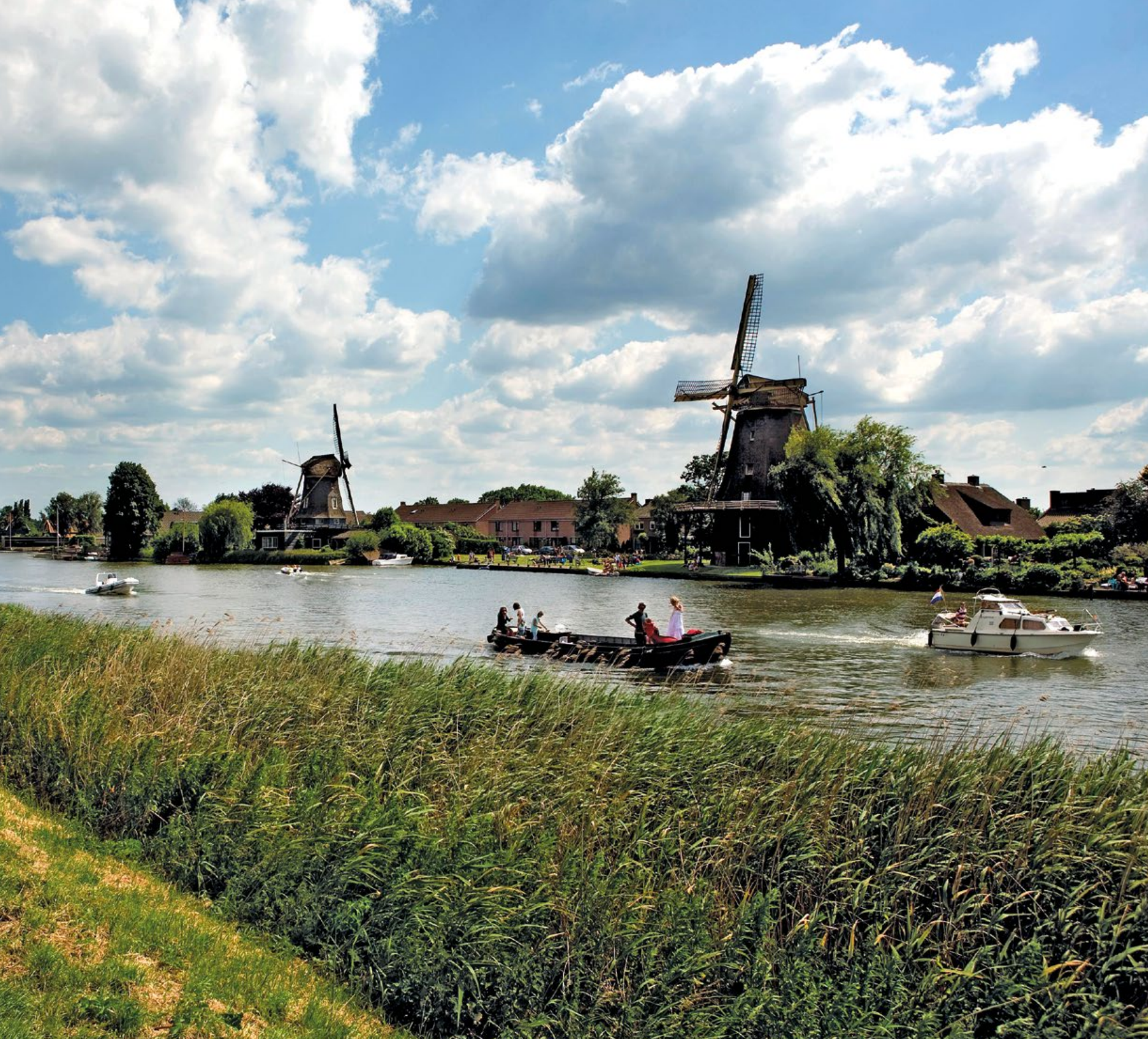
De Vecht bij Weesp