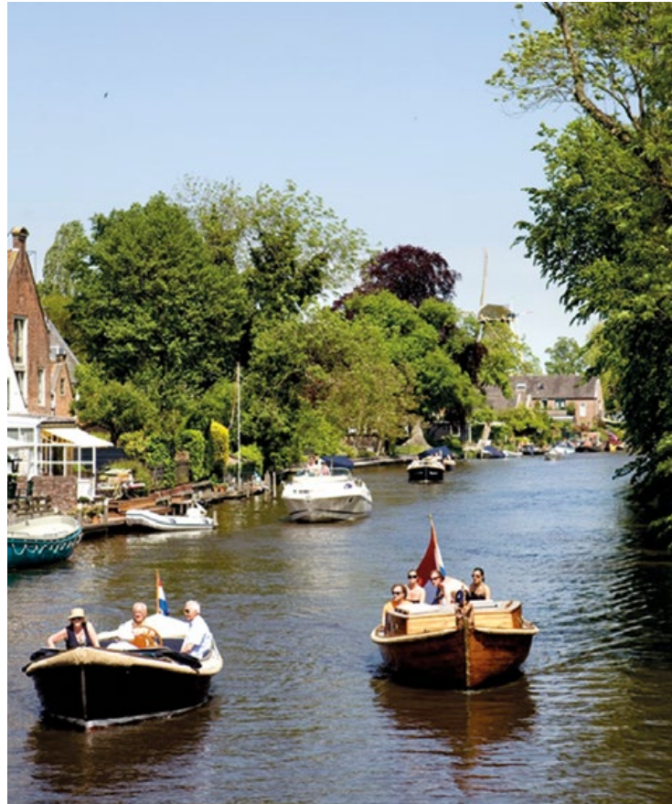
Pleziervaart geniet van het mooie weer op de vecht

“Waternet neemt veel mee uit dit project. Het omgevingsmanagement heeft een enorme ontwikkeling doorgemaakt. We vertalen onze ervaringen met de omgeving bij de Vecht door naar andere projecten en omgevingsmanagement is nu een belangrijk projectonderdeel geworden. Dat geldt ook voor de innovaties waarmee we gestart zijn tijdens de Vecht: de sensortechnieken in dijken en