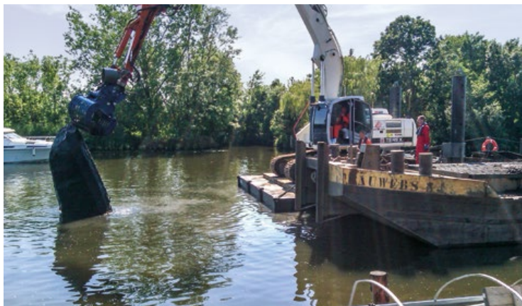
Wrak roeibootje aan de kraan