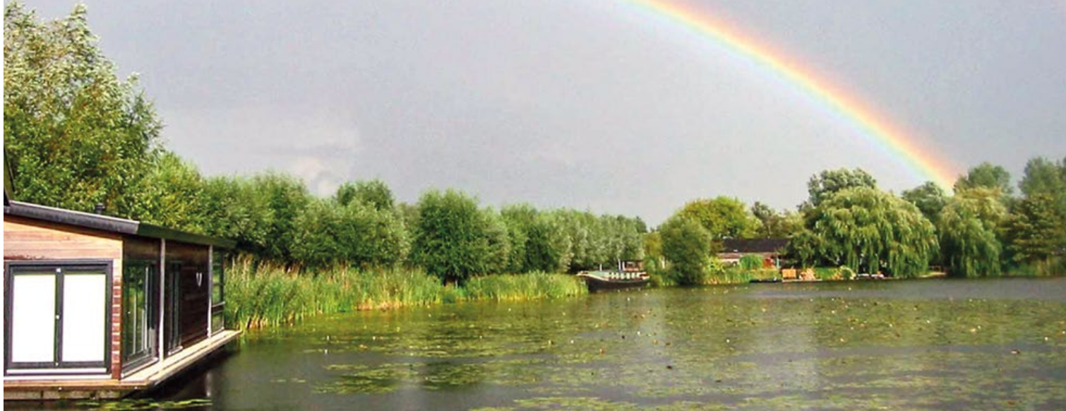
Natuur langs de Vecht