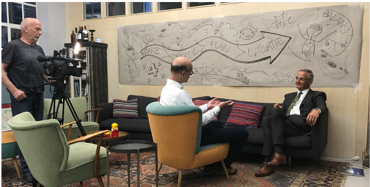
Video opname Column nr. 90, april 2018