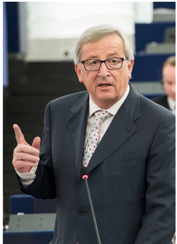
Jean Claude Juncker tijdens zijn 'State of the Union'-speech in 2017.

kijken, hoe we tot initiatieven kunnen komen. Zodat het opleidingsniveau bij bedrijven, vooral op HBO en MBO niveau, wordt verbeterd.