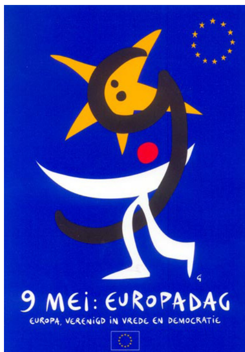
Elk jaar op 9 mei vieren wij Europadag