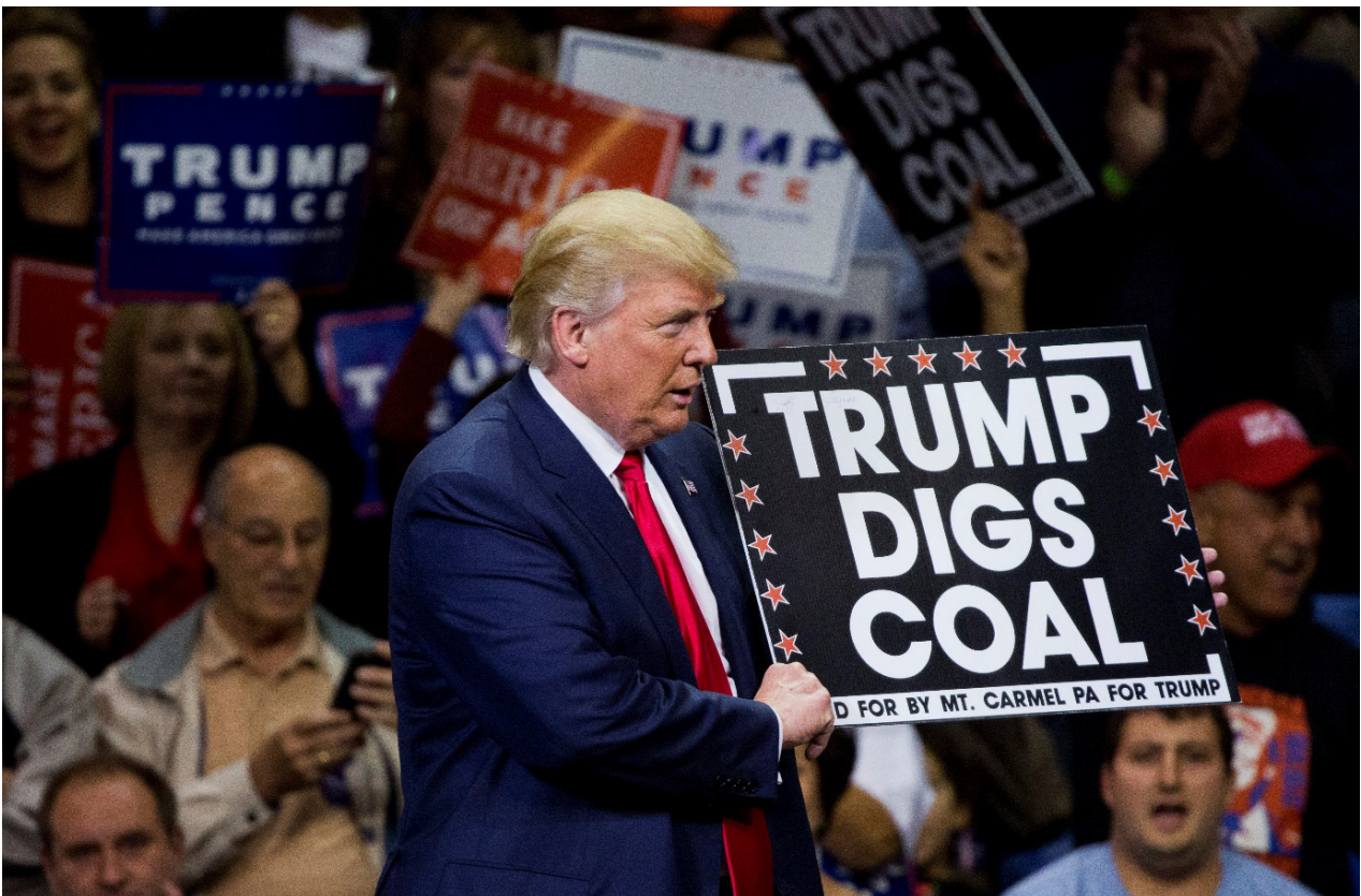
Amerikaanse president Donald Trump wees in 2017 het Parijs Akkoord af

is het meest omvattende akkoord in de strijd tegen de opwarming van de aarde. Het akkoord legt vast dat de temperatuur van de aarde niet meer dan twee graden Celsius mag stijgen. Maar belangrijker is het commitment om erin te investeren. Bijna 200 landen hebben het verdrag ondertekend. Ook Nederland en het Europees Parlement hebben ingestemd. De handtekeningen staan. So far so good", aldus de in Diessen woonachtige Europarlementariër (CDA/EVP-fractie) Lambert van Nistelrooij.