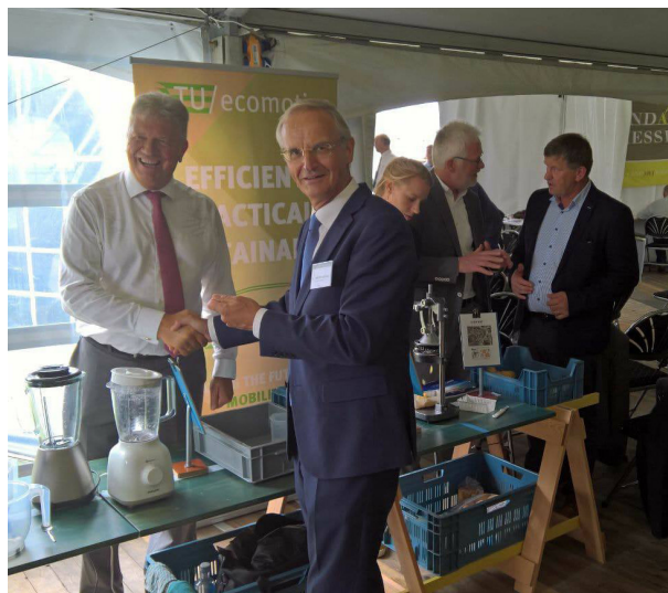
Het biobased paviljoen tijdens Landart Diessen 2017.

Europa die nu op de rem staat. Lambert van Nistelrooij constateert dat dit de Canadezen diep in hun gevoel raakt. “Canada wil verder met Europa. Inzet van kennis en gelijkwaardig optreden zullen de handel bevorderen. Alle aanleiding Europa zo snel mogelijk te resetten en onze toekomst niet langer te beletten.”