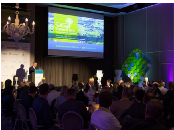
Lambert van Nistelrooij tijdens de Rural Summit 2017 in Eindhoven

“Het Europees Parlement heeft ook geld vrijgemaakt voor ‘Slimme Dorpen’, de ‘Smart Villages’. Het startsein wordt dit voorjaar gegeven en ik heb de Kempengemeenten hiervoor uitgenodigd. Komend najaar staat Brabant opnieuw in het teken van het platteland. Van 19 tot 22 oktober 2017 komt het ‘European Rural Parliament’ bijeen in Venhorst. Dat belooft een ware happening te worden en een mooie kans om er deze keer meer burgers bij te betrekken”.