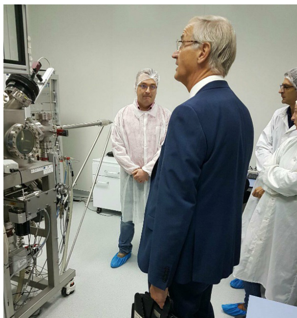
Lambert van Nistelrooij tijdens een werkbezoek aan een medisch bedrijf (oktober 2017).

In Brussel lever ik mijn bijdragen. Ik heb voorstellen gedaan voor garanties via het Junckerfonds. In juni komt er een boek uit voor start-ups. En samen met de lokale omroep Moergestel TV werk ik aan een documentaire over beginnende ondernemers in mijn eigen omgeving.