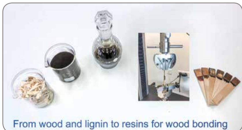
From wood and lignin to resins for wood bonding

Veel Europese eindgebruikers en merkeigenaren hebben de ambitie om de petrochemicaliën in hun huidige producten te vervangen door duurzame groene grondstoffen. Bovendien willen ze nieuwe markten ontwikkelen die niet haalbaar zijn met behulp van de huidige op fossielen gebaseerde normen, waardoor de reikwijdte van hun bedrijf wordt vergroot.