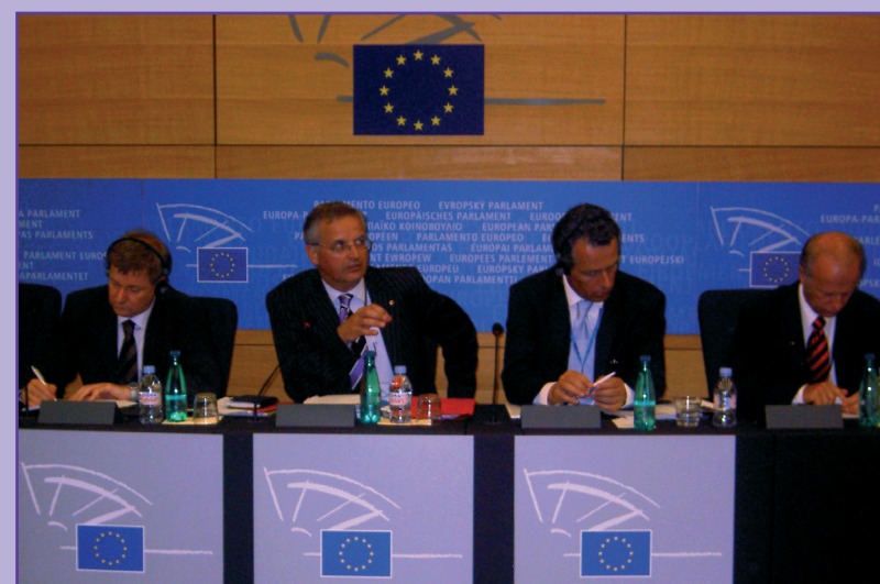
Met onze partners moeten we nu al beginnen met nadenken over de manier waarop we vanaf 2013 het Nederlandse en Europese regionale beleid moeten vorm geven.

In Europees verband is afgesproken in de periode 2009/2010 goed te kijken naar de uitgangspunten voor het beleid dat vanaf 2013 gevoerd gaat worden. Nu al is duidelijk dat er opnieuw ingrijpende veranderingen zullen zijn.