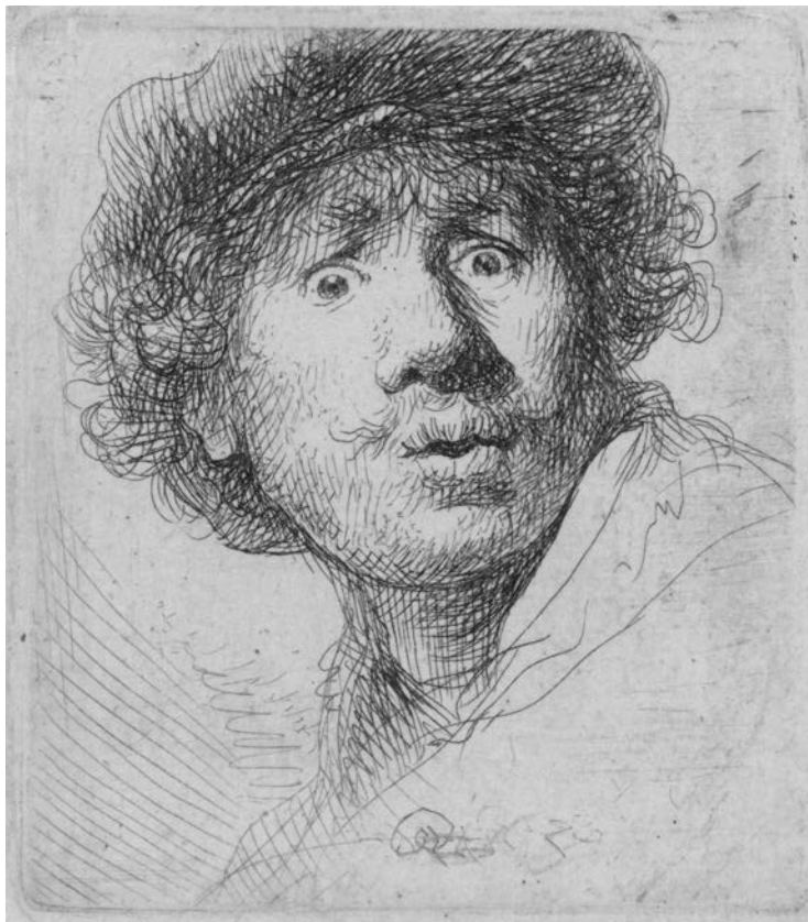
Figuur 1. Rembrandt Harmensz. van Rijn. Zelfportret met baret en opengesperde ogen (1630).