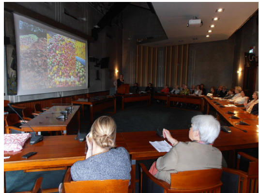
Bijeenkomst Schijndel, aftrap FoodBattle op 10 oktober