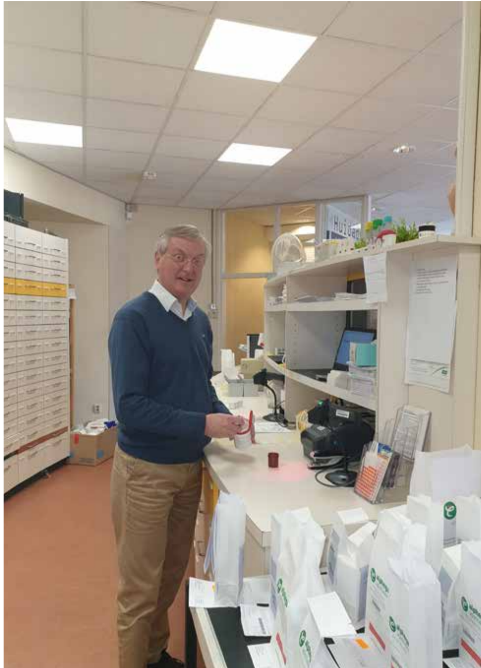
Van den Dries aan het werk

In Waddinxveen Noord is er nu nog maar één huisarts. Dat is zeker voor de toekomst te weinig. Dat hebben de huisartsen zelf ook al aangege-