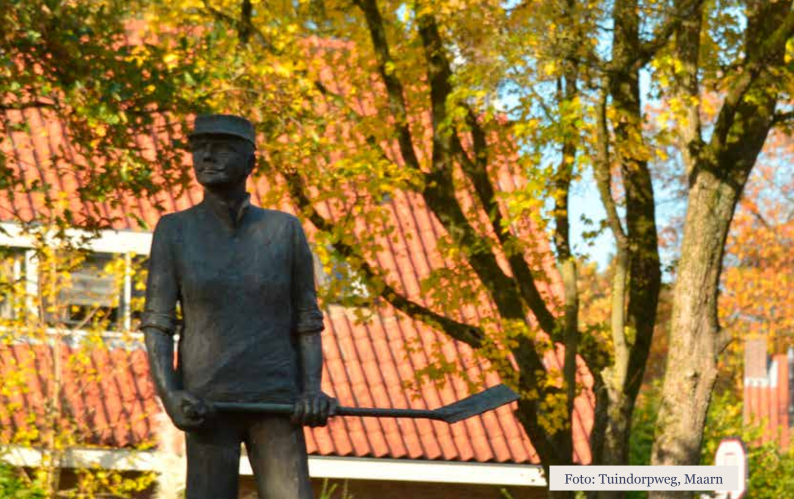
Foto: Tuindorpweg, Maarn