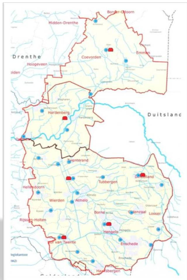
Figuur 1: Werkgebied Vechtstromen