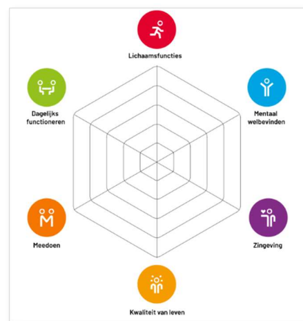
Figuur 1: De zes pijlers van positieve gezondheid.

Actief leven begint voor veel jongeren met sporten. CDA Dalfsen wil de bespeelbaarheid bij de clubs vergroten door kunstgras- of hybridevelden aan te leggen. CDA Dalfsen wil de zwembaden