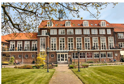
De Rusthoeve, gemeentelijk monument

In januari is de evaluatie dierenwelzijn aan de orde geweest en de nieuwe subsidieverordening voor gemeentelijke monumenten. Het aantal gemeentelijke monumenten is aanmerkelijk toegenomen en dat houdt dus in dat je de totale subsidie nu moet verdelen over een groter aantal monumenten. Het college had daarbij voorgesteld om de maximale hoogte van de subsidie te verlagen zodat nu veel meer monumenten in aanmerking kunnen komen. Een voordeel bij een nadeel.