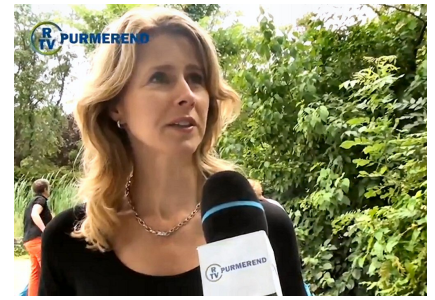
overweldigende belangstelling van de pers