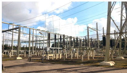
Werkbezoek bij Alliander, Oterleek

N a de ontvangst op het hoofdkantoor van Alliander in Alkmaar werd een bezoek gebracht aan een transformatiestation bij Oterleek.