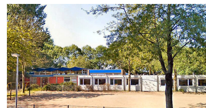
schoolgebouw aan de Mercuriusweg

Op basis van het verkeersonderzoek besluit het college de school te vestigen aan het pand aan de Mercuriusweg in de wijk Wheermolen. Omdat deze locatie gesloopt zou worden is er jaren geen onderhoud gepleegd aan het pand. Daarom vraagt het college 374.000 euro aan de raad om het pand geschikt te maken voor onderwijs.