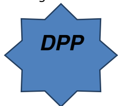
Diaconaal Platform Purmerend

Vorig jaar stelde wij ons de vraag: Wat weten we nu eigenlijk over eenzaamheid? En wat kunnen we er in Purmerend tegen doen? Om hier achter te komen hebben we de afgelopen maanden vele instellingen bezocht en gesprekken gevoerd over eenzaamheid. Uit deze contacten is onder andere het initiatief ontstaan om samen met het Diaconaal Platform een symposium te organiseren over eenzaamheid. Het Diaconaal Platform is de organisator van de dag.