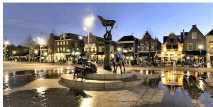
de Koemarkt bij avond

heel erg dronken buiten op straat loopt. Vanuit de meldkamer wordt er aan agenten op de Koemarkt gevraagd om polshoogte te nemen. Nog geen drie seconden later zien we een politieauto het beeld in rijden.