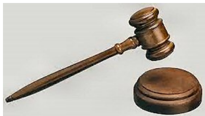
Jaarrekening vaststellen bij hamerslag

A ls alternatief werd gesuggered om de jaarstukken naar de leden te sturen ter goedkeuring, maar ook daarmee voldoen we niet aan de eis, dat uitsluitend de ALV de macht heeft om de goedkeuring te verlenen. We wachten dus de ontwikkelingen hieromtrent rustig af en eens zal dit als een soort hamerslag-besluit een rechtmatige voltooiing krijgen.