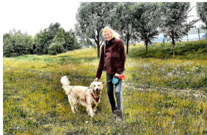
Honden uitrenveld Weidevenne

Door de regels voor het uitlaten van honden in de wijken te veranderen, komt er een verbetering voor hondenbezitters én niet-hondenbezitters.