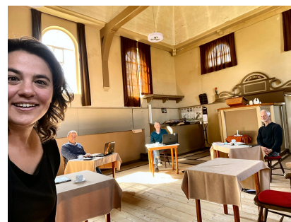
Interieur van de kerk

E en hele leuke kennismaking met actieve en enthousiaste mensen op een prachtige plek in de Beemster.