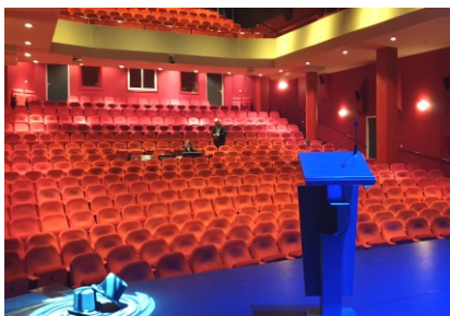
Grote zaal van de Purmaryn

Het steunpakket van het Rijk richt zich met name op in- stellingen met nationale en in- ternationale bekendheid, waar- van een aanzienlijk aantal in Noord-Holland gevestigd zijn.