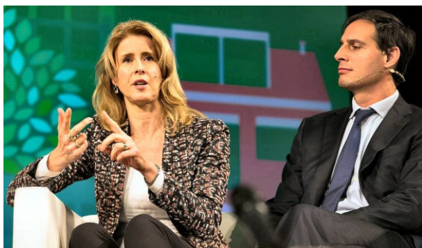
Mona Keijzer en Wopke Hoekstra