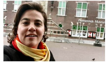
Eveline voor Purmerends Museum

zorgen dat de culturele sector niet stil komt te liggen.