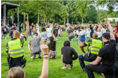
Vuist tegen racisme in Leeghwaterpark

D e raadsvergadering van juni had als sluitstuk een motie van Groen Links over Racisme en Discriminatie naar aanleiding van de betoging in het Leeghwaterpark.