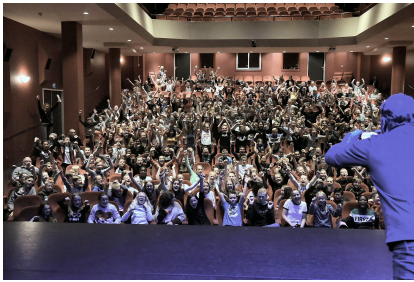
Groep 8 leerlingen in de Purmaryn

geeft en altijd bereid is mee te denken met amateurverenigingen die hier op dit podium hun voorstelling willen presenteren. Dat is iets waar ik trots op ben en dat we moeten koesteren.