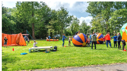
Het vernieuwde Kooimanpark

De komende jaren worden er heel veel woningen gebouwd in de stad. Het Kooimanpark ligt dicht bij de binnenstad en het Wagenweggebied waar de eerste bouwprojecten gerealiseerd gaan worden.