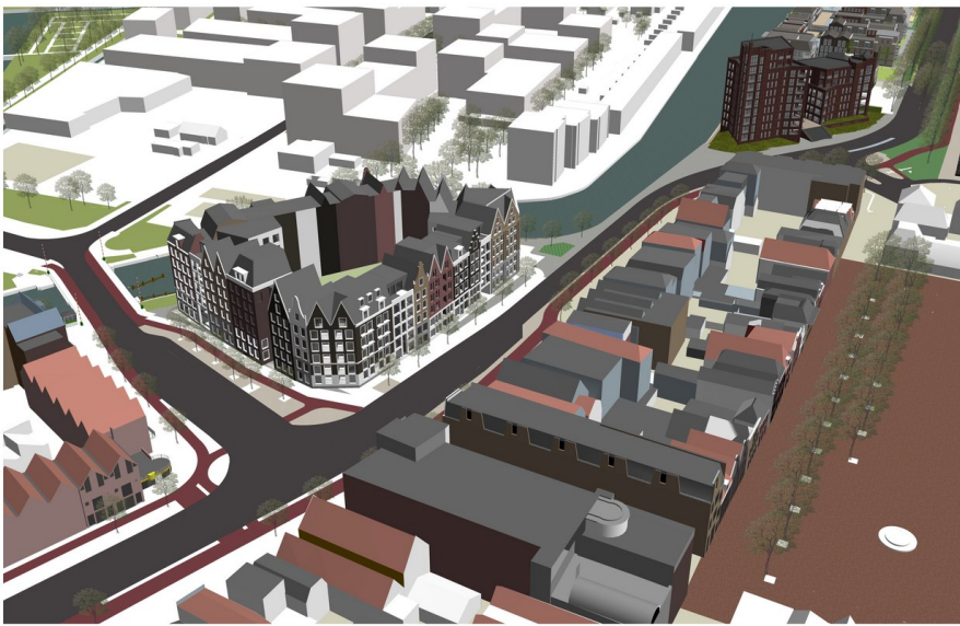
SNIPPE PROJECTEN BV juli 2019

"Soms moet je als overheid loslaten en soms moet je iets beschermen. Het CDA vindt dat we op deze plek in de historische binnenstad moeten kiezen voor beschermen en zelfs versterken van hetgeen er nog is." Dat was de start van het betoog waarmee het CDA anderhalf jaar geleden in de gemeenteraad de strijd aanging tegen de hoogbouwplannen op de PostNL locatie aan de rand van onze historische binnenstad.