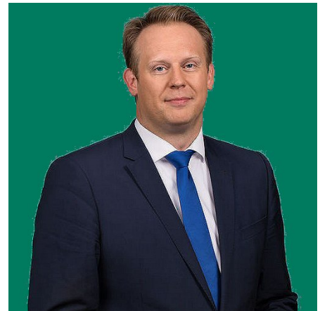
Pieter Heerma, voorzitter van de Tweede Kamer fractie van het CDA

commentaren zijn je deel. Aan de andere kant is het natuurlijk heel bijzonder, dat je namens een deel van de bevolking, die specifiek een stem aan jou heeft gegeven, of omdat je nu eenmaal op een verkiesbare plaats op de lijst stond, mee te mogen praten en beslissen over zaken die in het belang van ons land zijn. Er spelen momenteel veel belangrijke onderwerpen. Denk aan het klimaat en de pensioenen om slechts twee onderwerpen te noemen.