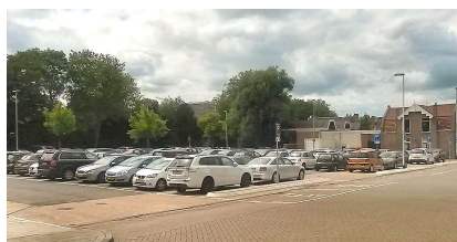
Parkeren op de Schapenmarkt

Met het bovenstaande maatregelenpakket worden grote stappen gezet, maar het leek alsof de ontwikkeling van de Schapenmarkt hierbij op de achtergrond is geraakt en niet meer in beeld is.