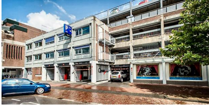
Willen Eggert Parkeergarage

Met een parkeerverwijs systeem met dynamische borden wordt dat duidelijk gemaakt en is het voor bezoekers direct zichtbaar waar beschikbare parkeerplaatsen zijn. Een andere maatregel die hier onder valt is het beter kenbaar maken van de mogelijkheden.