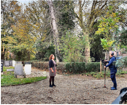
Crisis als kans voor cultuur

volop bezig die ondersteuning te bieden, zodat de sector goed door de crisis kan komen.