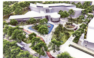
Schetsontwerp van parkeergarage bij het stadhuis van Purmerend

Met de verankering van leefbaarheid in de visie Purmerend 2040 en prachtige voorbeelden als de nieuwe garage voor de binnenstad zijn we op de goede weg.