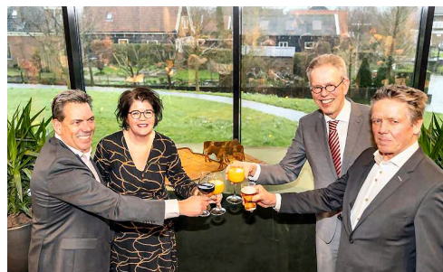
Op 27 februari 2020 hebben de gemeenteraden van Beemster en Purmerend het herindelingsadvies vastgesteld.

Overigens hebben wij al vele jaren een goede verstandhouding met onze CDA collega's in de Beemster.