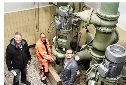
Wat speelt zich af vier meter onder de grond?

M ichiel: "Nee, pas als het afvalwater in het gemaal een bepaald niveau bereikt, treden de pompen in werking. Je kunt je voorstellen dat er in de nachtelijke uren minder gepompt hoeft te worden. Mensen liggen dan immers in bed. Aan de andere kant heb je ook weer piekuren, waarbij de pompen 30 liter afvalwater per seconde door de persleidingen sturen richting waterzuivering. Dat zijn de piekuren, waarop we allemaal naar de wc gaan, onder de douche staan en onze vaatwassers en wasmachines aanzetten."