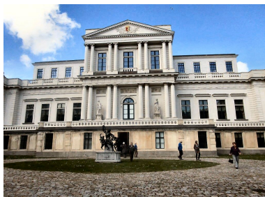
Provinciehuis Paviljoen Welgelegen

Op maandag 23 april kunnen wij als CDA leden te gast zijn bij de Provinciale Staten in Haarlem.