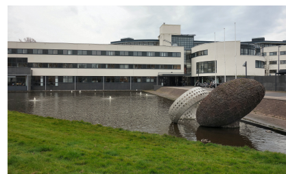
Het Stadhuis van Purmerend

U it de cijfers blijkt dat de Purmerender positiever is over de gemeentelijke dienstverlening. Vier jaar geleden gaf men hiervoor een 6,7, in 2015 een 6,9 en dat is nu gestegen naar een 7,2. Het cijfer is hoger als gevraagd wordt het laatste contact met de gemeente te beoordelen, dan geeft men bij een bezoek aan het stadhuis een 7,8. In 2015 was dit nog een 7,5.