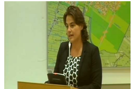
Eveline tijdens de algemene beschouwingen

Eén van de oorzaken hiervan is de toegenomen invloed van media op het politieke speelveld. Het ad hoc commentaar op twitter of facebook is razend snel, maar lang niet altijd afgewogen en met onvoldoende context. Ik ben geschrokken van de omgangsvormen die ik de laatste weken gezien heb. Ze dragen niet bij aan een oplossing van het probleem. Tegelijkertijd moeten we oppassen dat we legitieme zorgen niet wegzetten als racistische waanbeelden van domme mensen.