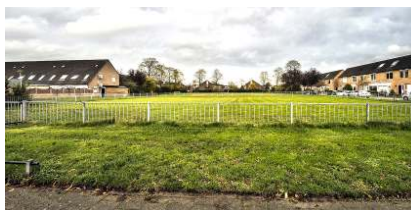
Terrein bij het Drontermeer

D e tweede locatie, het Drontermeer in de Purmer Zuid, ligt voor ons moeilijker. Duidelijk is voor het CDA dat deze locatie uitermate geschikt is voor woningbouw. Wat wij ons daarbij wel afvragen is of wij hier ook tijdelijke woningen willen bouwen. Moet je wel experimenteren in een compacte woonwijk? Het antwoord van de CDA-fractie is 'nee'. Als wij namelijk ter plaatse kijken dan past het fysiek prima, maar vragen wij ons af of het vanuit esthetische oogpunt ook wenselijk is. Op de locatie stond een tijdelijk schoolgebouw voor bijna 18 jaar en nu willen we weer een nieuw 'tijdelijk' gebouw neer zetten. Je kunt je afvragen 'wat is tijdelijk'. Het CDA vindt dat de buurt duidelijkheid verdient.