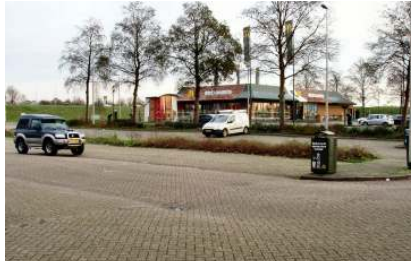
P&R-terrein naast de McDonalds

P&R-terrein naast de McDonalds tijdelijke woningen te realiseren.