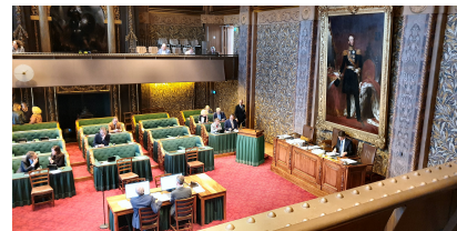
Vergaderzaal van de Eerste Kamer

den ze in de verschillende commissies voorbesproken en wordt er teruggeblikt en vooruitgekeken op het College van Senioren. Een mooie naam voor het fractievoorzittersoverleg.