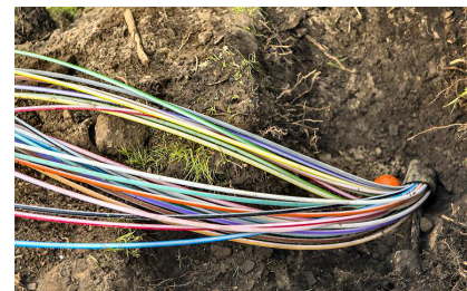
Aanleg glasvezelnetwerk voor snel internet

Hiervoor is een snelle verbinding nodig. Dit kan gerealiseerd worden door de aanleg van een glasvezelnetwerk voor woningen, winkeliers en bedrijven in stedelijk gebied. Via glasvezel kan immers veel meer uitwisseling van gegevens plaatsvinden.