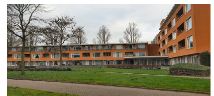
Seniorencomplex De Botterhoek

De bewonerscommissie houdt zich bezig met kleine praktische zaken en vormt de schakel tussen de bewoners en Wooncompagnie. Over zaken die spelen in het complex, maar ook rondom in de buitenruimte. De activiteitencommissie zorgt voor veel momenten om samen iets te doen. In de eigen activiteitenruimte worden wekelijkse en maandelijkse vaste activiteiten georganiseerd zoals sjoelen, klaverjassen en bingo. Maar ook activiteiten om gezamenlijk te eten, zoals de stampottenmiddag. De activiteitencommissie zorgt zelf voor inkomsten om alles te kunnen organiseren. Met de baropbrengst en de jaarlijkse rommelmarkt wordt hiervoor geld ingezameld. Eén keer per maand komt de 'Botterpraat' uit, een krantje waar alle activiteiten van de maand worden aangekondigd. Ook dit krantje wordt volledig door bewoners gemaakt.