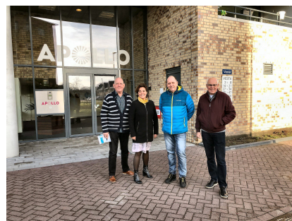
Bestuur huurdersvereniging Apollo

De huurdersvereniging wil graag op de hoogte blijven als er nieuwe bewoners in het complex komen wonen. Zij geven aan dat ze wel last hebben van de AVG. Vanwege deze relatief nieuwe privacywetgeving mogen de namen van nieuwe bewoners niet doorgegeven worden. De verhuurder mag wel het huisnummer doorgeven als iemand daar nieuw is komen wonen. Op deze manier kunnen nieuwe bewoners schriftelijk geïnformeerd worden over het bestaan van de huurderscommissie en worden ze geattendeerd op de mogelijkheid om lid te worden. De leden worden gedurende het jaar geïnformeerd met nieuwsbrieven en tijdens de ALV (Algemene Leden Vergadering).