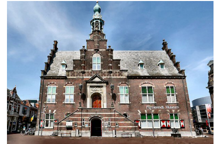
Het Purmerends Museum

van Purmerend. Het vertelt ons het verhaal van ons gebied en leert ons lessen over wie wij zijn. Een museum dat jaarlijks duizenden bezoekers trekt en waar veel vrijwilligers actief zijn. Vrijwilligers die vol passie vertellen over het museum en over de stad, als echte ambassadeurs.