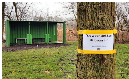
Weerstand tegen deze locatie aan het Oudelandsdijkje

E n dan de zoektocht naar een geschikte locatie en de gevolgen voor de bewoners in de omgeving. Dit zal altijd een worsteling blijven tussen verschillende belangen. Het college heeft in de beantwoording op vragen van de VVD en in een memo van de wethouder aangegeven met welke criteria en waar is gezocht naar een geschikte plek. En met welke maatregelen men de verwachte overlast wil beperken. We begrijpen de keuze van het college voor het Oudelandsdijkje, maar hebben ook begrip voor de onrust die over de gekozen locatie is ontstaan.