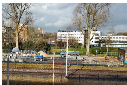
Aanleg parkeerterrein aan de Stationsweg

Het is ook niet voor niets dat de gemeenteraad in 2018 hierop voorgesorteerd heeft met het vaststellen van de mobiliteitsvisie, waarin ingezet wordt op een goed bereikbare en autoluwe binnenstad met meer ruimte voor wonen groen, fiets- en wandelpaden. Waar doorgaand verkeer naar de A7 wordt geweerd en waar auto's aan de randen kunnen parkeren. Deze visie op mobiliteit vormt de basis van de vele wijzigingen op het gebied van parkeren in en rond het centrum. Naast wijzigingen in de tarieven op straat, parkeertijden, vergunning gebieden en het gebruik van de parkeergarages komen er ook parkeerplekken terug. De 85 parkeerplekken aan de Stationsweg worden op dit moment aangelegd. Straks kan je hier tot 1 juli gratis parkeren, daarna geldt een laag dagtarief van € 2,- per dag. Aan de voorkant van het stadhuis komt een nieuwe ondergrondse parkeergarage met ca. 320 plekken. De voorbereidingen voor de aanbesteding zijn inmiddels gestart.