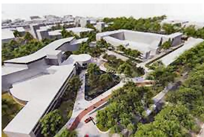
Impressie van de ondergrondse parkeergarage voor het stadhuis

Op vrijdag 24 januari 2020 heeft wethouder Eveline Tijmstra het plan gepresenteerd voor een nieuwe parkeergarage in de binnenstad. De garage komt voor het stadhuis, wordt geheel ondergronds en biedt straks plek aan 320 auto's over drie verdiepingen.