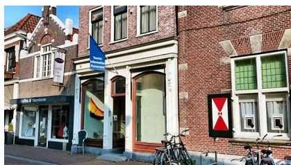
VVV/museumwinkel in de Peperstraat

Het gat in de muur, de opening tussen VVV en museum, is er eindelijk, en vormt letterlijk en figuurlijk een opening tot samenwerken. Cultuur maakt een stad aantrekkelijk. Niet alleen voor de inwoners, maar ook voor bezoekers. Dat dit belangrijk is, blijkt uit de ontwikkeling van de VVV/ museumwinkel die aan het Purmerends Museum is gekoppeld. Purmerend zet meer in op toerisme en deze plek neemt daarbij een belangrijke rol in. 2019 was het eerste volledige jaar waarin de VVV/museumwinkel was geopend.