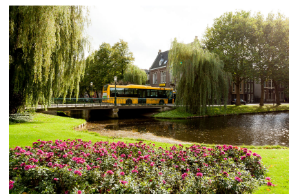
Stadsgracht in Purmerend

D aarnaast kleedt groen ook de stad aan. In dat opzicht is het misschien wel de jas van de stad. Neem nu alleen al qua uitstraling, de toeg van bomen aan de Purmersteenweg. Of de wilgen aan de stadsgracht. Dit zijn beeld en sfeer bepalende elementen in onze stad.