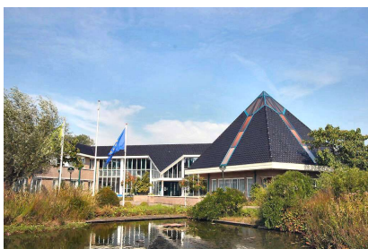
Het gemeentehuis van Middenbeemster

Als fusiebestuur wilden we ook een bijeenkomst organiseren met de penningmeesters van zowel Beemster als Purmerend. Dit om elkaar inzicht te geven in de wederzijdse financiële situatie en vooruit te kijken hoe we de financiën van beide partijen op termijn in elkaar kunnen schuiven.