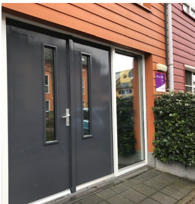
Odion locatie Ismailiastraat Purmerend

Zo bezocht ik De Boomgaard en Woonlocatie Ismailiastraat. Op uitnodiging van het CDA Medemblik bezocht ik Maria Mater in 't Veld, een mooi voorbeeld van wonen en welzijn voor en door ouderen. De Boomgaard is een orthopedagogisch dagcentrum voor kinderen en volwassenen met een verstandelijke en/of lichamelijke beperking. Op de locatie Ismailiastraat wonen volwassenen met een verstandelijke beperking en volwassenen met een verstandelijke en auditieve beperking.