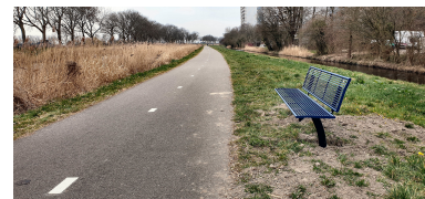
Bankje aan de Westerdraaij

H et is een dossier dat ik niet los kan laten. In 2018 keer ik terug in het nieuwe college met een nieuwe portefeuille, waaronder het beheer van de openbare ruimte. Ik gá hier nu over, realiseer ik mij. Dan móét het toch mogelijk zijn om de bankjes teruggeplaatst te krijgen? We gaan met een groot team van ambtenaren en de ouderen, die ik jaren geleden al gesproken heb, ter plekke langs om te kijken wat nodig is. Een kleine vijf jaar later staan er dankzij de enorme inzet van de ambtenaren en de medewerking van het Hoogheemraadschap weer twee bankjes op de Westerdraaij. Eindelijk kan ik het dossier afsluiten. In de politiek gaat het niet alleen om grote onderwerpen.