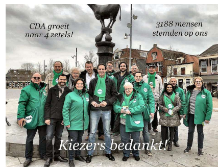
Bezoek van minister Wopke Hoekstra

Voor mij betekende dit dat ik per direct mijn werk als wethouder heb moeten beëindigen. Een hectische en emotionele tijd, waarbij we als team in staat zijn geweest om heel snel de knop om te zetten. Op vrijdag heb ik mijn werk neergelegd, zaterdag hebben we nieuwe plannen gemaakt en maandag was ik full-time aan het werk voor de campagne. Met het voornaamste doel: ervoor zorgen dat de geplande hoogbouw van 23 verdiepingen op de PostNL locatie niet gerealiseerd wordt.