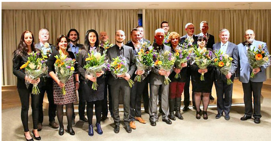
Een deel van de nieuwe gemeenteraad