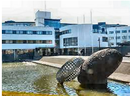
Stadhuis van Purmerend