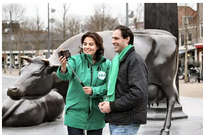
Eveline samen met minister Hoekstra

we dit allemaal voor elkaar gekregen hebben.