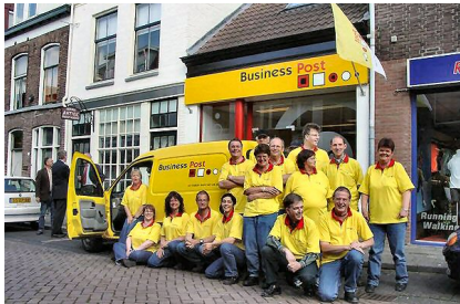
Postbezorgers van Baanstede

I n maart bracht de CDA-fractie een werkbezoek aan Baanstede. Momenteel biedt Baanstede, als sociale werkvoorziening, werk aan 850 mensen in de groenvoorziening, business post en print, beschut werk en detachering. Van de gedetacheerden is de helft in dienst bij die werkgever.