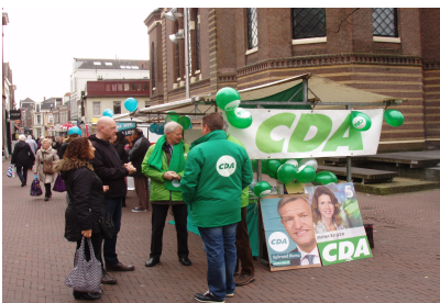
Verkiezingsmarkt op de Kaasmarkt.

Daar gaven ook een flink aantal leden acte de presence, waardoor het CDA daar prominent aanwezig was. Zelfs Tweede Kamerlid Pieter Heerma vond de tijd om daarbij enige tijd met zijn aanwezigheid bij te dragen aan deze activiteit.