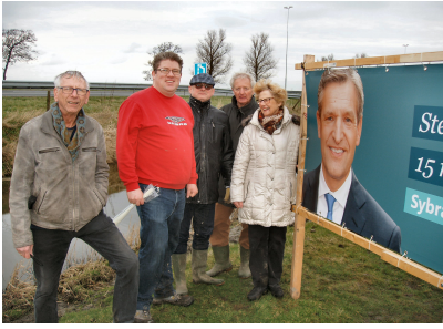
canvasdoek in de Wijde Wormer bij de A7

Daarnaast werden er weer 30 sandwich borden door geheel Purmerend geplaatst aan evenzo veel lantaarnpalen.