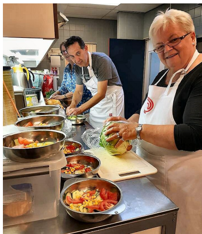
Samen eten in de Taborkerk

Ieder jaar koken we voor een Samen Eten project in de Taborkerk. Allemaal om mensen over de drempel te helpen om in beweging te komen.