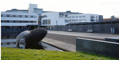
Gemeentehuis van Purmerend