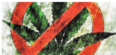
Wij zijn wiet roken helemaal beu

H et CDA wil druggebruik aanpakken door in te zetten op preventie en voorlichting aan de ene kant, en handhaving aan de andere kant. Het CDA rekent ook op de medewerking en de verantwoordelijkheid die ouders moeten nemen, wanneer ze maar enigszins het vermoeden hebben dat er (soft)drugs in het spel zijn. Beter dan dat handhaving/justitie aan de deur komt met een boete voor hun kind omdat deze is bekeurd voor openlijk drugsgebruik in de openbare ruimte.