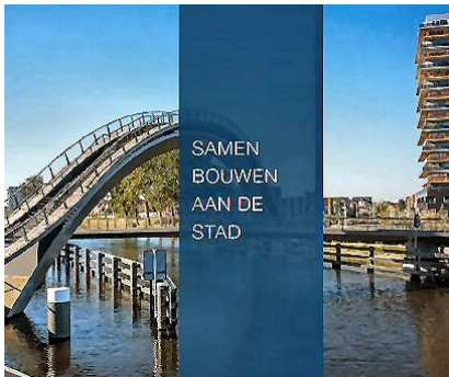
Voorkant van het coalitieakkoord