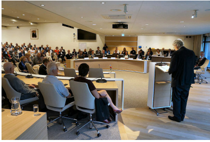
De raadzaal van Purmerend