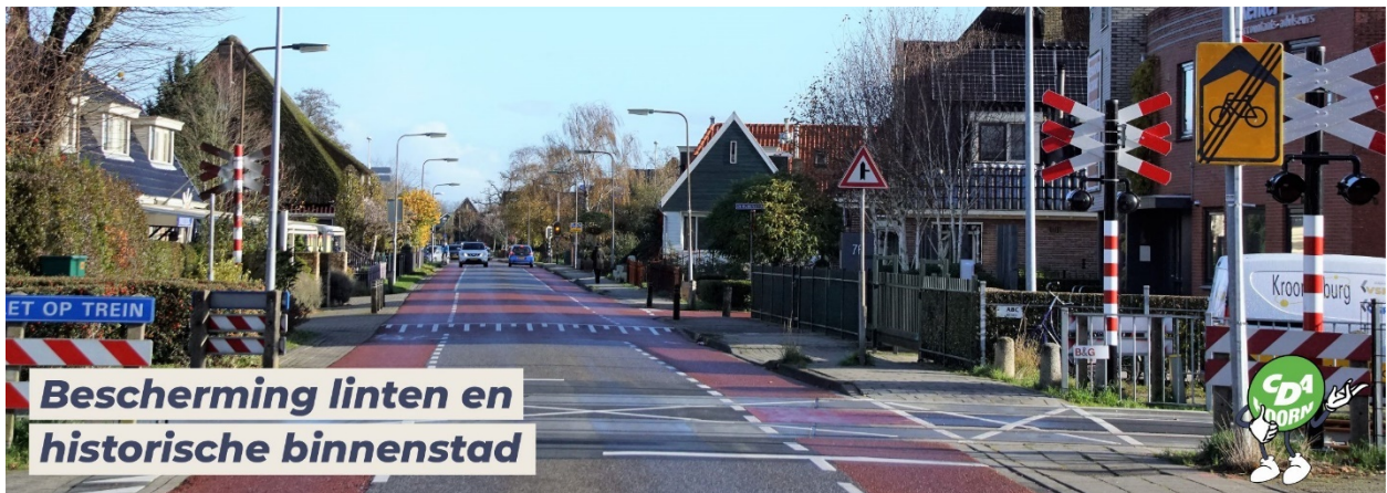
Bescherming linten en historische binnenstad