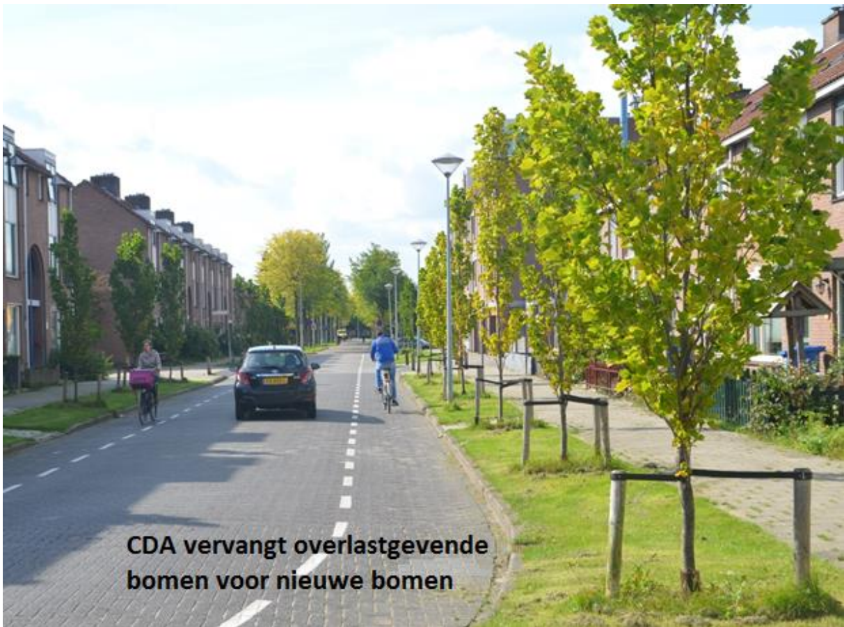
CDA vervangt overlastgevende bomen voor nieuwe bomen

Bomen en groenvoorziening in wijken zijn een gevoelig en belangrijk thema. Er zal een brede discussie met bewoners moeten komen over het groen in de wijken, met name over bomen. Dit gaan we doen aan de hand van een nieuwe Groenvisie. Het kappen van grote overlast gevende bomen en het aanplanten voor nieuwe bomen mag geen taboe (meer) zijn. Op veel plekken worden bomen langzamerhand te groot voor hun leefomgeving, wat problemen geeft zoals forse schaduwwerking of wortelopdruk in de bestrating. Dit leidt tot steeds meer klachten van bewoners. De gemeente mag dit gegeven niet negeren. Als de eigen bewoners de grote overlast gevende bomen vervangen willen zien worden door nieuwe jonge bomen die weer passend zijn in het straatbeeld, dan moeten hiertoe juridische én financiële mogelijkheden voor zijn. Het CDA stelt daarom financiële middelen beschikbaar om met een uitgebalanceerd programma binnen woonwijken grote overlast gevende bomen te vervangen voor nieuwe jonge bomen die beter passend zijn binnen de woonwijk.