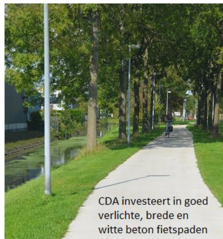
CDA investeert in goed verlichte, brede en witte beton fietspaden