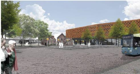
Impressie van het nieuwe stationsplein met parkeergarage, busstation en stationsgebouw van de Museum Stoomtram

Het CDA heeft ingestemd met de ontwikkeling van het stationsgebied, de bouw van een parkeergarage voor 1250 auto's en 2000 fietsen, de verplaatsing van het busstation en de aanpassing van de turborotonde naar een verkeersplein met bijbehorende groene golf. Deze inspanningen en investeringen zijn nodig om Hoorn met de auto en de fiets bereikbaar te houden, het historisch centrum (aan de andere zijde van het spoor) te beschermen en de bus- en treinreiziger een hoger kwaliteit en comfort te bieden. Dit plan heeft een doorlooptijd van meerdere jaren. Medio 2021-2022 moet het nieuwe stationsgebied klaar zijn. Een markant gezichts- en aandachtspunt hierbij is de positie en huisvesting van de Museumstoomtram. Hier heeft CDA nadrukkelijke aandacht voor.