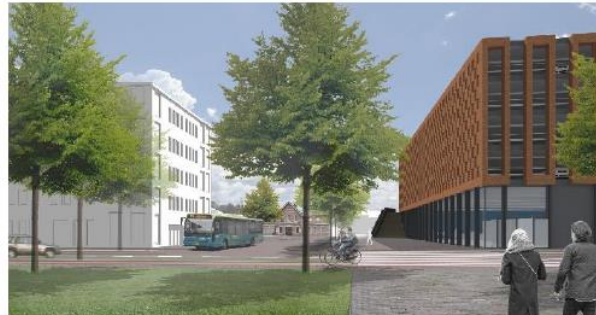
Impressie van de ingang van het nieuwe stationsplein vanaf de Van Dedemstraat