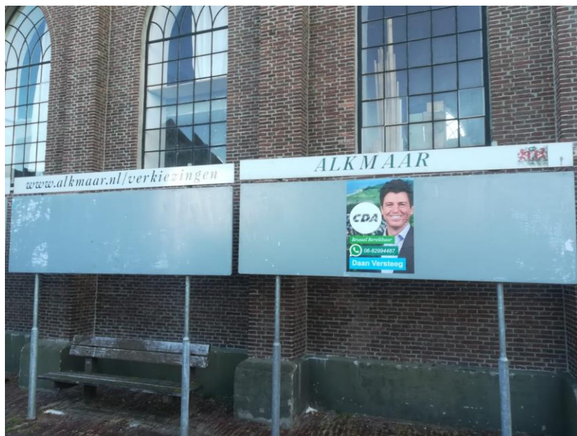
Verkiezingsborden te Oost-Graafthijk, mei 2019

Copyright © 2019 CDA Alkmaar, All rights reserved. U krijgt deze nieuwsbrief omdat u lid bent van het CDA Alkmaar