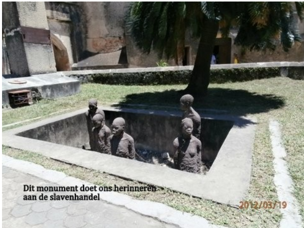
Dit monument doet ons herinneren aan de slavenhandel