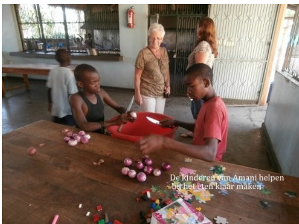
De kinderen van Amani helpen bij het eten klaar maken

Het volgende eiland, het was eigenlijk een zandbank, was veel vrolijker. Men had er tenten gebouwd om uit de zon te kunnen zitten. Snel gingen de kleren uit om in het mooie frisse water te springen op zoek naar koralen. De leiding had gezorgd voor allerlei lekkere hapjes en een