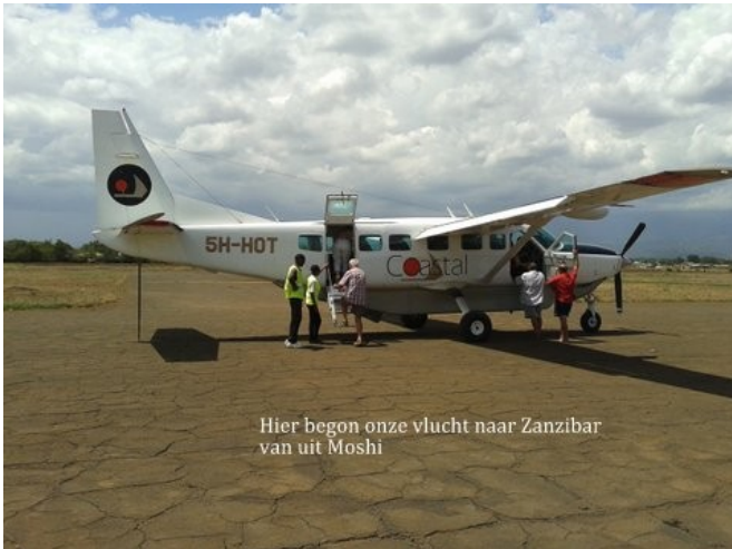
Hier begon onze vlucht naar Zanzibar van uit Moshi