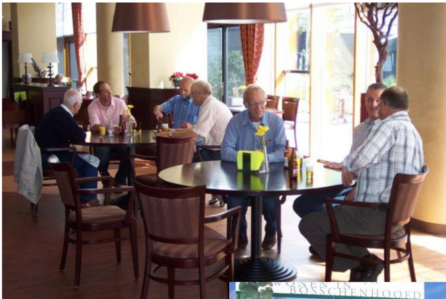
Fietstocht CDA Halderberge