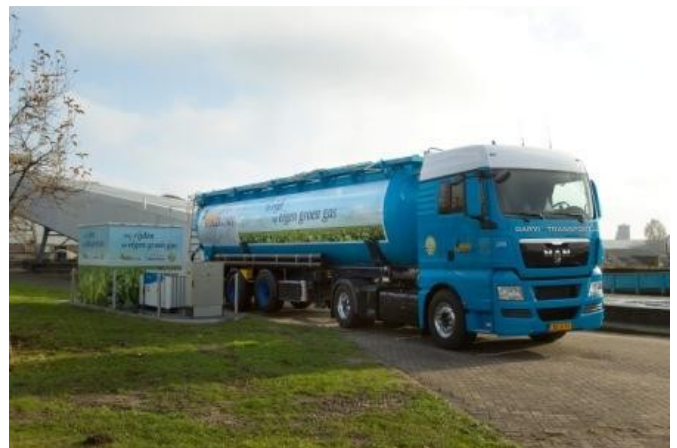
Vrachtauto op gas bij het eigen tankstation

Bij het wassen van de bieten dreigt er ook nog het een en ander verloren te gaan waar ook nog, o.a. suiker in zit. Wij voeren dit water met suiker naar een methaanreactor/groen gas-reactor en zetten deze suikers om naar groen gas. Wij gebruiken dus twee stromen om groen gas te produceren. Overigens rijden een aantal van onze bedrijfsauto's en vrachtauto's zonder problemen op ons eigen groen gas."