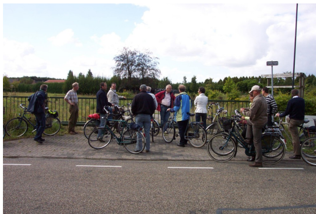
Foto's gemaakt tijdens de fietstocht in september 2009