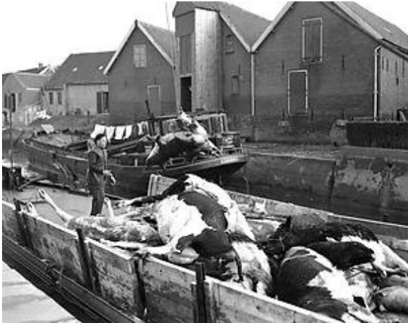
Met scheepsladingen vol, hier vanuit Tholen, werden de kadavers op transport gezet. Het was een triest beeld wat zich op grote schaal in het rampgebied voltrok.

De polder Kaas en Brood had niet alleen een echte vuilnisbelt, waar al het huisvuil van de gemeente