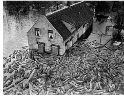
Enorme hoeveelheden vlas die in de boerenschuren lagen opgeslagen, dreven doelloos rond in het zoute water en konden als verloren worden beschouwd

Voor de wat oudere jeugd brak er een tijd aan wat je het best kunt omschrijven als dat van "Sil de strandjutter". Enorme hoeveelheden alledaagse dingen werden tussen alle troep en kleine kadavers gevonden. Van nieuwe bezems tot badkuipen en van klompen tot beddengoed en weet ik veel wat nog meer. Ook geld en andere waardevolle spullen werden gevonden, maar die werden keurig netjes ingeleverd bij onze plaatselijke koddebeier, pastoor of hoofd van de school. Je moet dit "jutter" wel in het juiste perspectief zien. De Tweede Wereldoorlog was juist afgelopen en de mensen hadden het niet breed, anders gezegd, en dit klinkt misschien wat