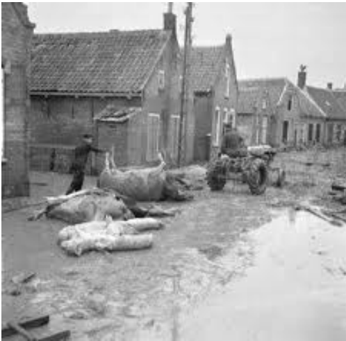
10.000 den stuks vee waren verdrongen maar alles moest wel opgeruimd worden

Stampersgat lag letterlijk op de grens van de watersnoodramp. De Gastelsedijk Noord, waar wij aan woonden, hield het water, dat vanuit het noorden op de dijk beukte en dreigde net naast ons huis door te breken, met moeite tegen. Al scheelde het niet veel. Met man en macht zijn toen tientallen vrachten met kinderkopjes en klinkers in het gat naast ons huis gestort om te voorkomen dat de Gastelsedijk Noord zou doorbreken en de Gastelse polder, met alle gevolgen van dien, onder water zou schieten. Het was best wel beangstigend te zien hoe mensen in lichte paniek kris kras door elkaar liepen om te trachten enige coördinatie in deze chaos te brengen. Burgemeester Hofland was ook ter plaatse, en stuurde waar hij sturen kon. Hij werd gedurende zijn ambtsperiode nu voor de tweede maal met een nationale ramp van ongekende omvang geconfronteerd. Eerst in 1940-1945 met de Tweede Wereldoorlog en nu weer in 1953 met de watersnoodramp. Op ons dorp Stampersgat wachtte men angstig af wat de storm verder nog in petto had. Het kerkhof kwam gedeeltelijk onder water te staan en ook op het suikerfabrieksterrein werden extra