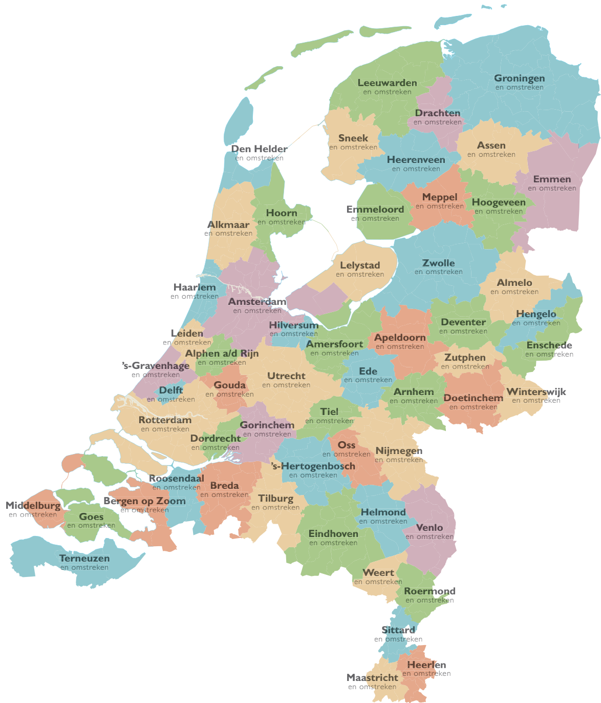
Figuur 3 Het aantal inwoners (op 1 januari 2014) binnen het grondgebied van de beoogde 57 nieuwe gemeenten van Nederland