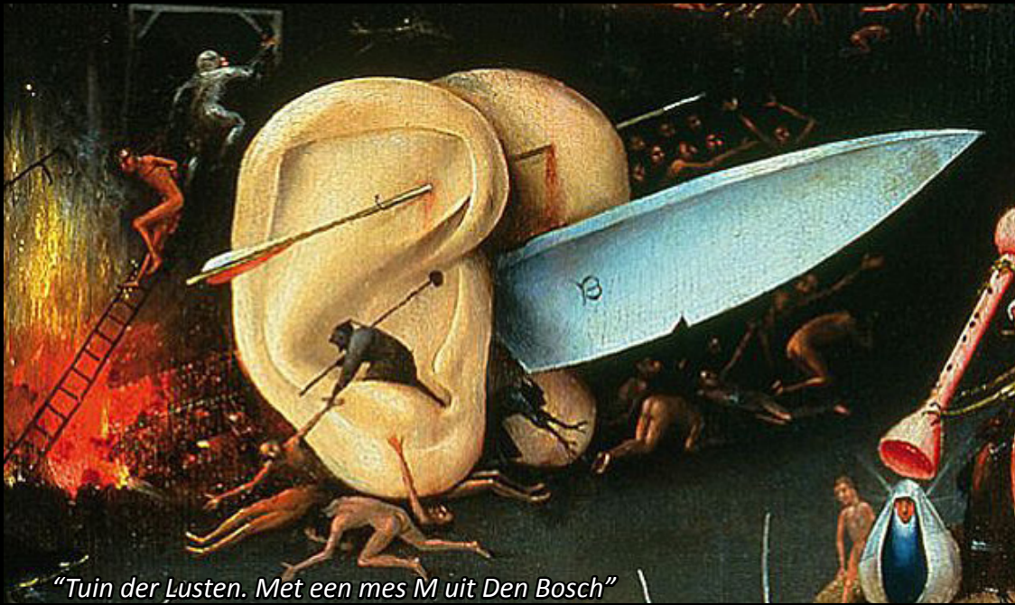
"Tuin der Lusten. Met een mes M uit Den Bosch"