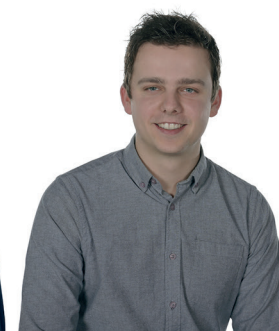
5. Yanick Cillessen Gennep