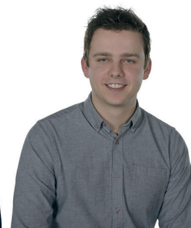
5. Yanick Cillessen Gennep