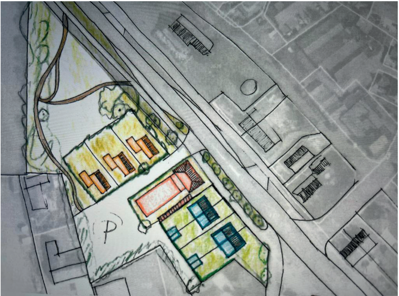
Schets herontwikkeling locatie voormalige bakkerij Jacobs, Rijksweg 35 Milsbeek