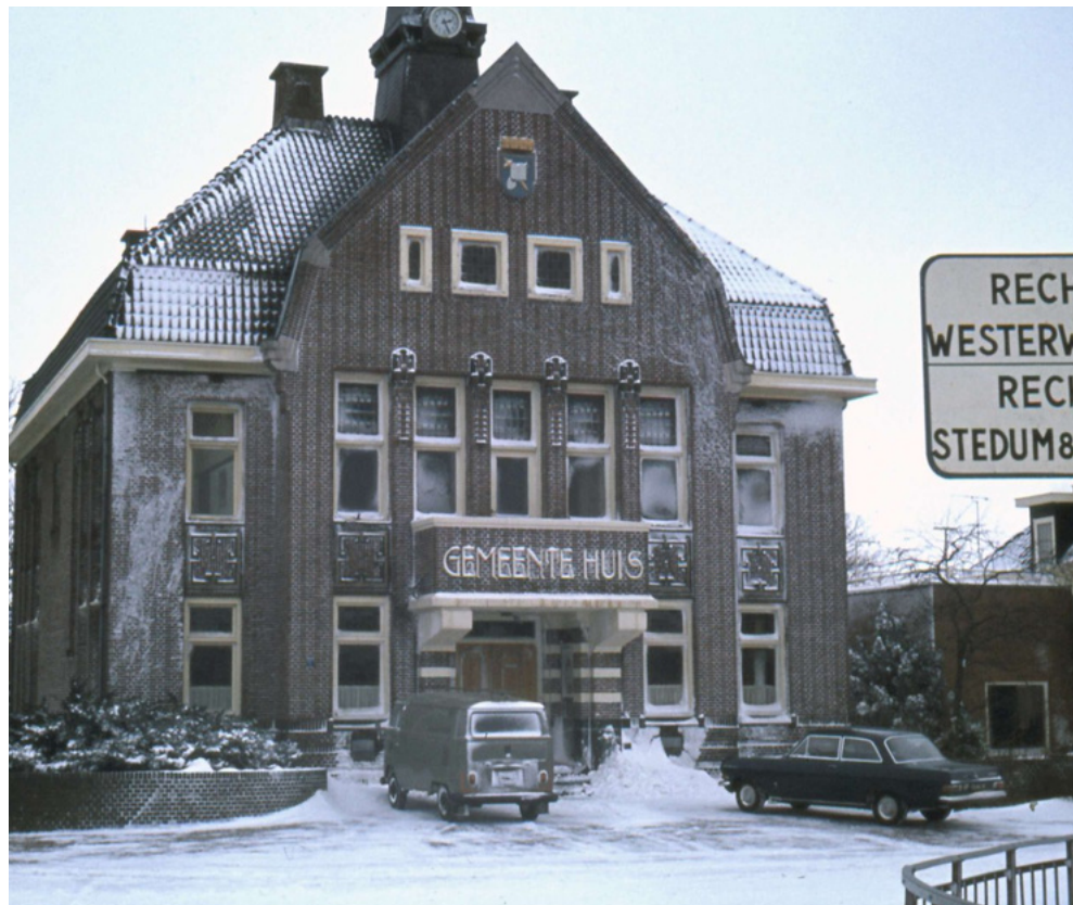
EEN FOTO UIT ONGEVEER 1970.