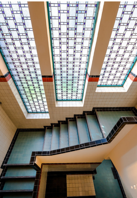
HAL BERLAGEHUIS USQUERT