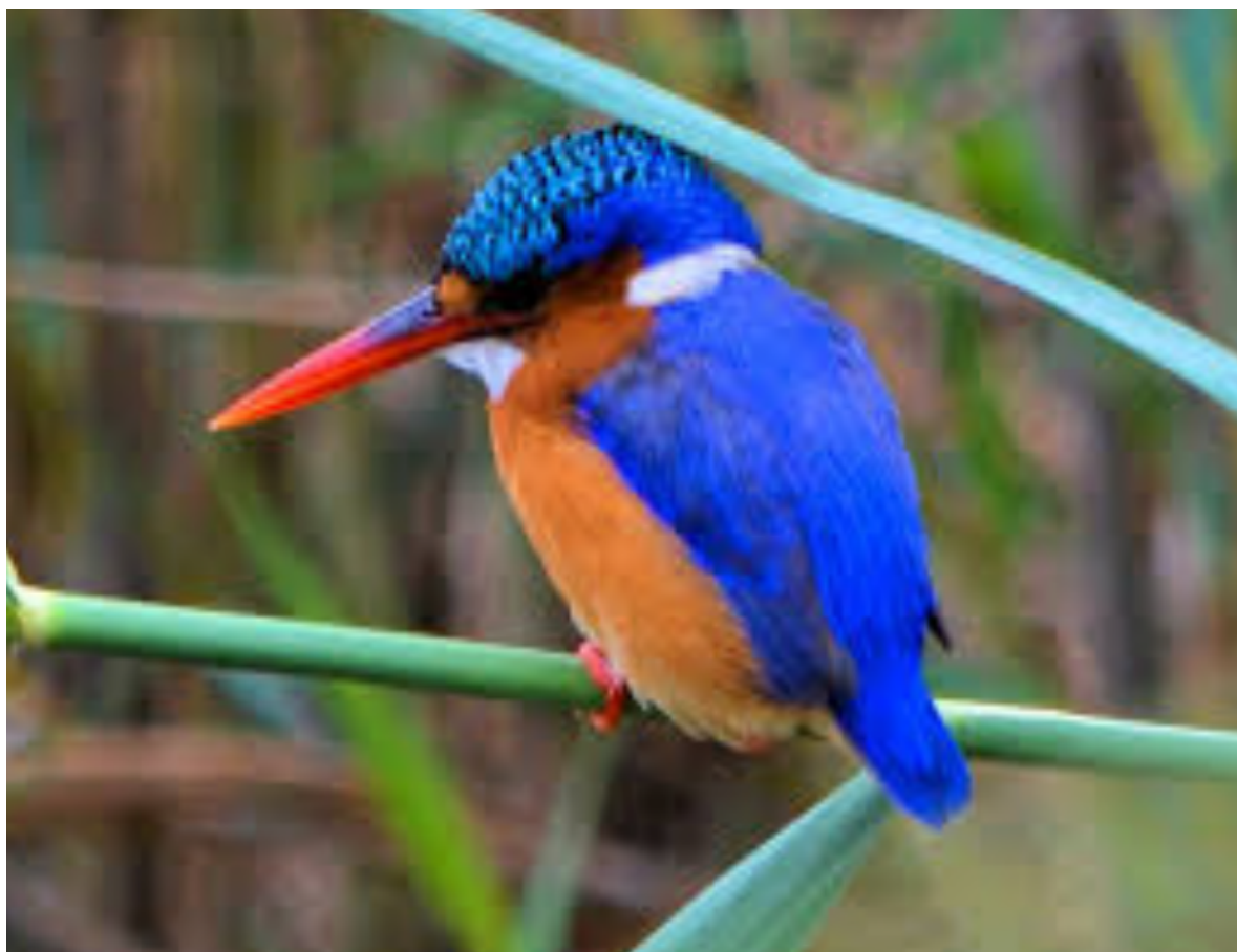
'De IJsvogel, symbool van het toerisme in Westerwolde'