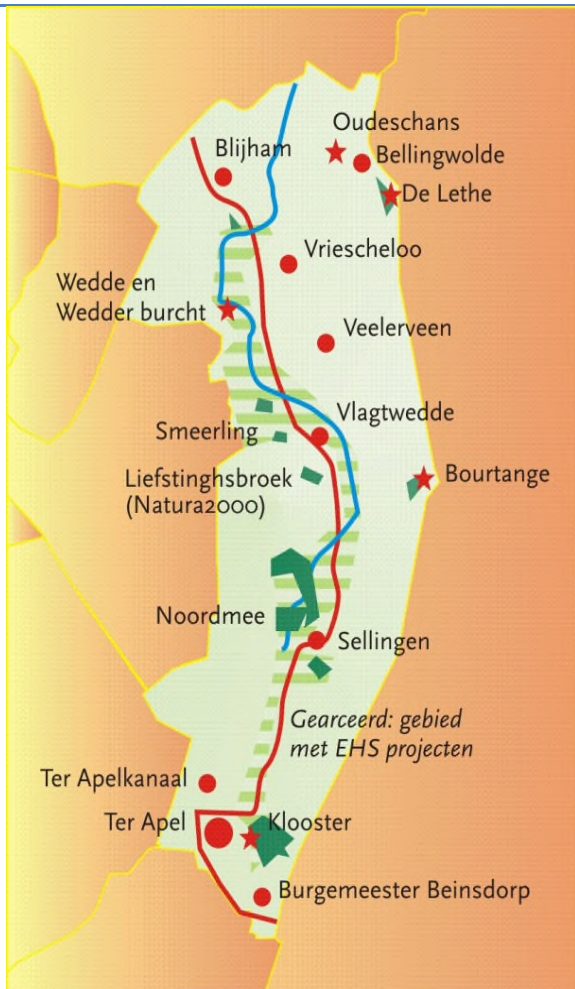
kaart 1: Westerwolde

Belangrijk voor Westerwolde is verder dat de venen in de omgeving laat ontgonnen zijn. Aan het begin van de 20 e eeuw was het afgraven van de Groninger venen al ver gevorderd, maar het gebied ten westen van Westerwolde hoorde bij de laatste ontginningsgebieden. Aan Duitse zijde is vanaf de Tweede Wereldoorlog tot aan de dag van vandaag