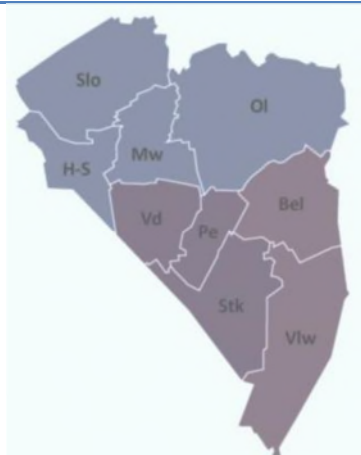
kaart 3: Zuidoost Groningen (BSVVP)

De alternatieven die voor Bellingwedde en Vlagtwedde – gelet op de bestuurlijke discussie in Oost-Groningen eind 2013/begin 2014 – relevantie hebben, zijn BSVVP (kaart 3) en BSVOP (kaart 4), ofwel Oost-Groningen en Zuidoost-Groningen als respectievelijke onderdelen van de zogenaamde horizontale- en verticale variant.