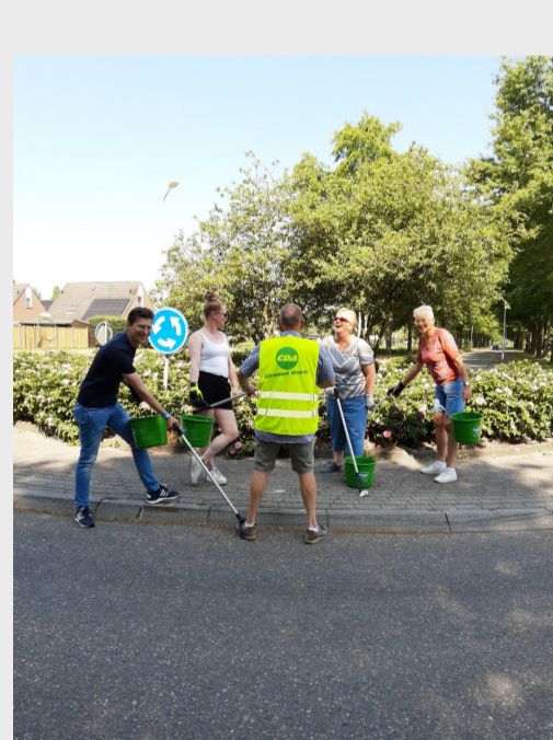
Samen zwerfafval opruimen in Wolvega