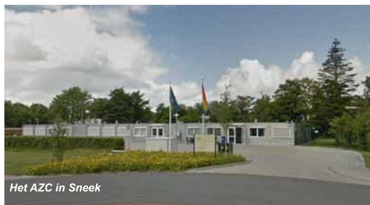
Het AZC in Sneek

In de raadsvergadering van maart hebben we besloten mee te werken aan een haalbaarheidsonderzoek, op verzoek van het COA, voor mogelijk de vestiging van een Regionale Opvanglocatie in Sneek. In 2015 is besloten mee te werken aan de vestiging van een AZC in de Noorderhoek in Sneek. In goed overleg tussen COA, buurt en gemeente is toen overeenstemming bereikt over de inrichting van het huidige centrum. Het COA en de gemeente zijn uitgegaan van een termijn van maximaal 10 jaar, met de afspraak na vijf