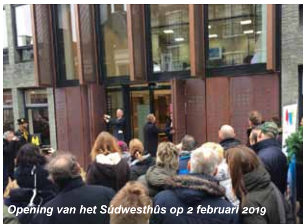
Opening van het Súdwesthûs op 2 februari 2019

Het Súdwesthûs, het nieuwe gemeenteloket aan de Marktstraat in Sneek is geopend met een open dag. De organisatie verwachtte een 1000 tal inwoners, het waren er meer