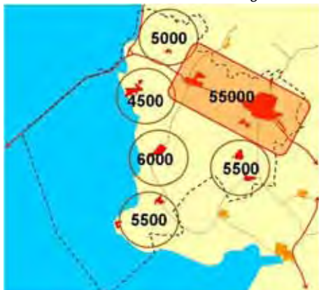
De zes clusters binnen de gemeente

en de gemeente. Dat laatste vind ik een winst voor ons als CDA'ers. De mensen kunnen het niet alleen maar de overheid kan niet alles bepalen. We moeten het echt samen oppakken. Dat is waar het CDA in mijn beleving voor staat. Er blijkt ook dat dorpen, buurten en wijken steeds beter in staat zijn om zelf te bepalen hoe de toekomst van hun leefomgeving eruit zou moeten zien. Het is aan de gemeente om samen met de professionele organisaties in het maatschappelijke middenveld deze 'eigen kracht' te stimuleren.