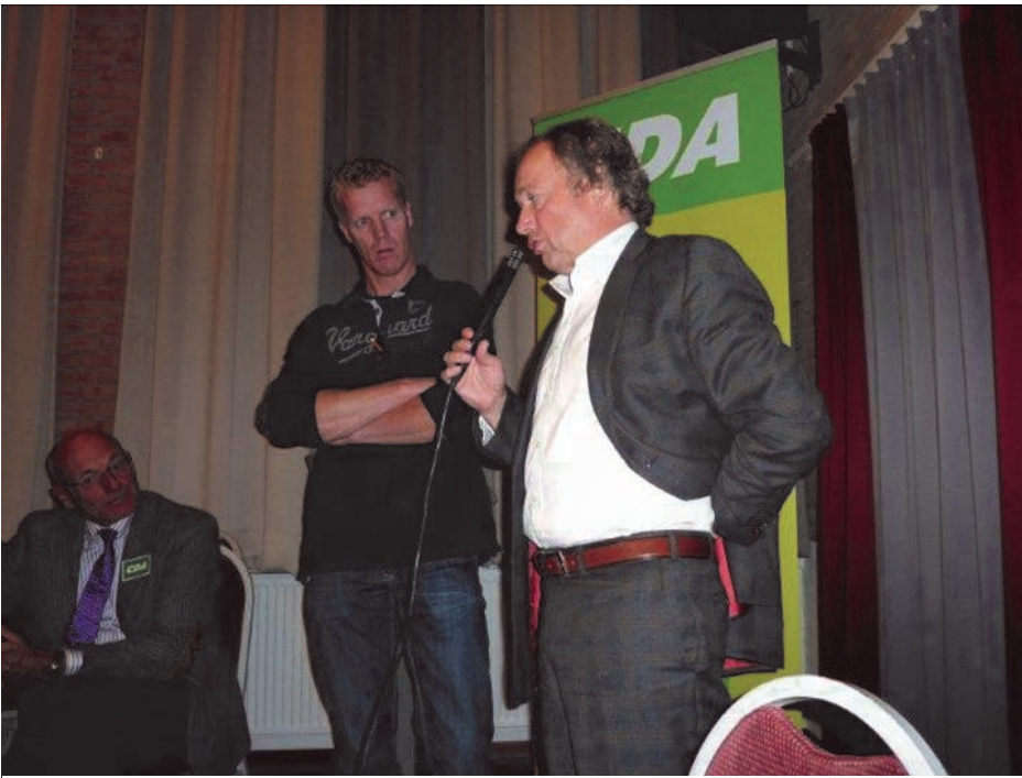
Staatssecretaris Henk Bleker tijdens de ALV.