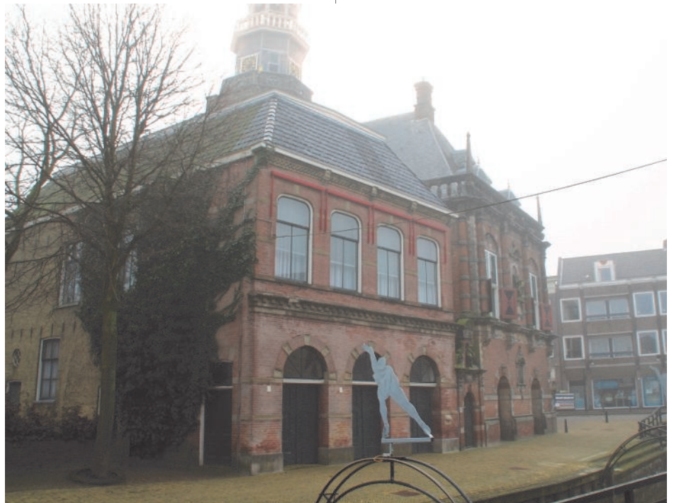
De Vleeskeuring onder het stadhuis van Bolsward waarin een jongeren centrum moet komen.

Belangrijk voor onze gemeente is een huishoudboekje die financieel gezien op orde is. Niet alleen op de korte termijn, maar ook op de lange termijn. Het is niet gemakkelijk om dit te realiseren in deze economische tijden